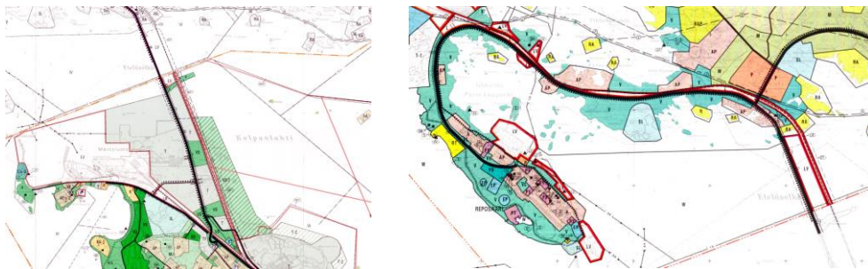
Otteet osayleiskaavoista. Vas. Meri-Porin OYK 1999, oik. Reposaari-Tahkoluoto-Lampaluoto-Ämttö OYK 1996.

Reposaaren sillasta pohjoiseen alueella on voimassa oikeusvaikutukseton Reposaari-Tahkoluoto-Lampaluoto-Ämttö -osayleiskaava 1996 (KV hyv. 24.3.1997). Siinä Reposaaren maantien eteläpuolelle on osoitettu kevyen liikenteen väylä Reposaaren sillalta aina Reposaareen asti.