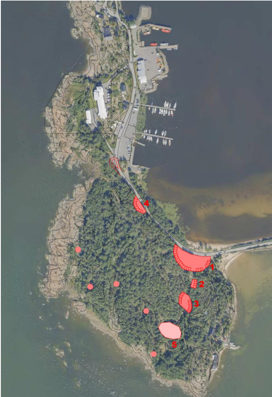
Kuva 3. Pysäköintialueet merkattu numeroilla 1-4. Alue numero 5 ehdotetaan varattavaksi BSF:n käyttöön venetrailereiden säilytyspaikaksi. Pyöreät merkinnät ovat paikkoja, jotka voitaisiin osoittaa tilapäiseen majoitukseen.