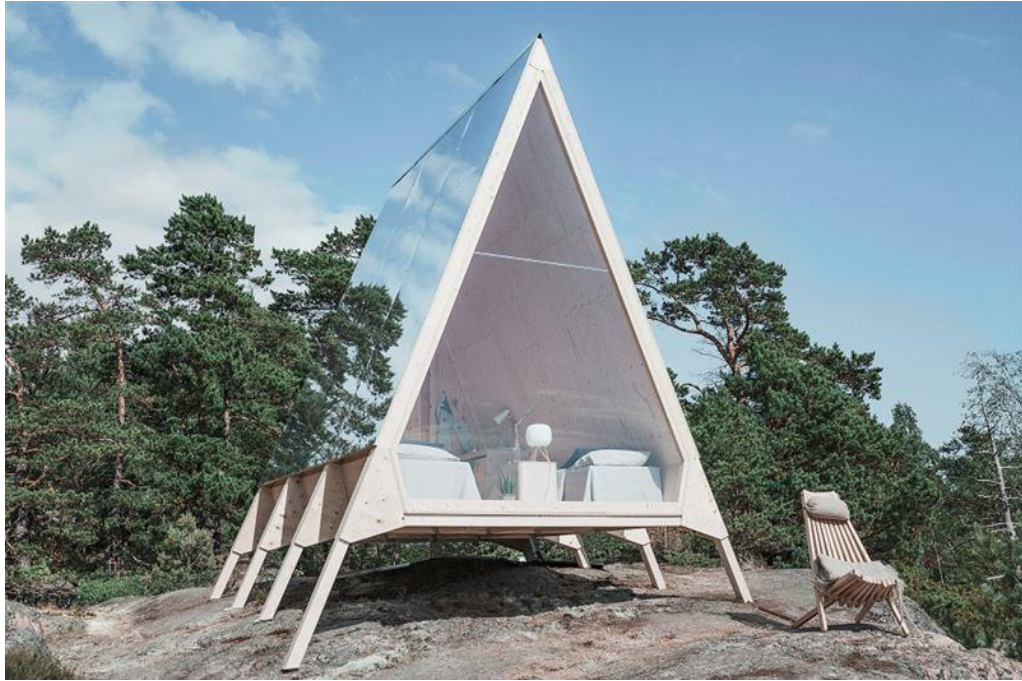
Kuva 5. Helsingin merellisillä retkeilyalueilla voi yöpyä aurinkokennoilla ja lämmittimellä varustetuissa Nollamökeissä. Myös nämä ovat siirrettäviä ja soveltuisivat hyvin Kallon takarannalle ( https://nollacabins.com/ ).