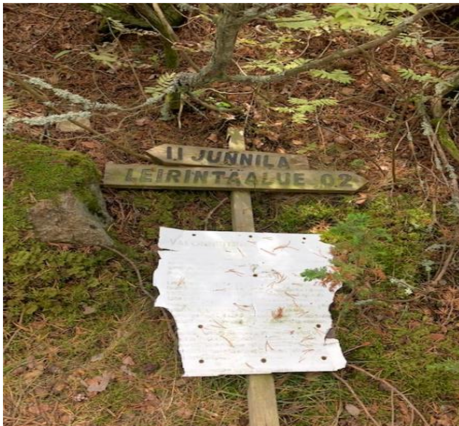
Kuva 11. Reposaari-kierroksen infotaulut ja opastusviitat ovat joko kadonneet tai tuhoutuneet lähes kokonaan.