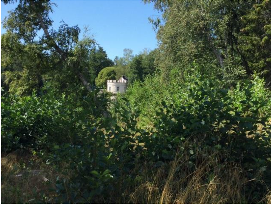
Kuva 15. Takarannantien vesakot peittävät näkymän Junnilanjärvelle ja leirikeskukseen. Ne peittävät myös tiellä liikkuvien näkyvyyttä, mikä on selvä turvallisuusriski.