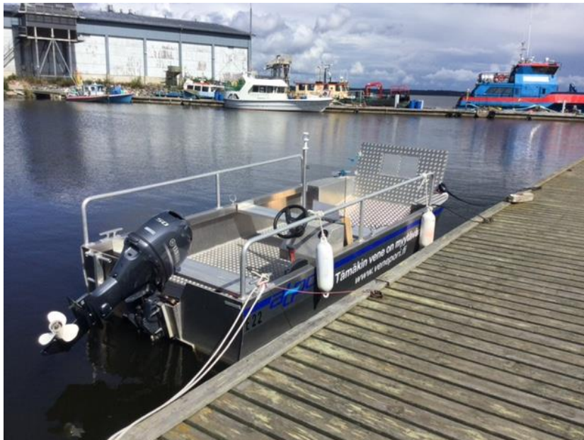
Kuva 13. Kallo-Reposaari yhteysvene kesällä 2021 Merimestan laiturissa

Kallo-Reposaari pyörälautta aloitti kokeiluluontoisesti toimintansa heinäkuussa 2021. Toimintaa pyörittää kaksi kalastusoppaiksi valmistunutta henkilöä VV Outdoors-yhtiönsä kautta. Lauttana toimii vuokravene, johon mahtuu 6 ihmistä ja polkupyöriä. Lähtöpiste Kallossa on BSF:n laituri ja Reposaareissa Merimestan vieressä oleva laituri. Pyörälautta on erinomainen täydennys Yyterin pyöräilyreittien kannalta. Se lyhentää matkaa Yyteristä Reposaareen noin 10 km:llä. Pyörälautta parantaa pyöräreitin turvallisuutta merkittävästi, sillä raskaan liikenteen käyttämällä ja vilkkaasti liikennöidyillä Mäntyluoto-Tahkoluoto maantieosuudella ei ole pyörätietä.