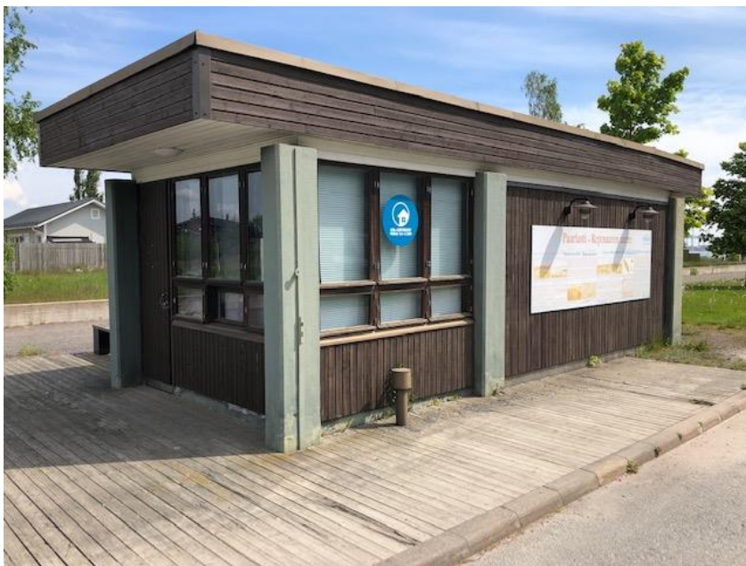
Kuva 16. Loma-asuntomessujen infokioski tyhjillään keskeisellä paikalla Reposaarta

Porissa vuoden 2008 loma-asuntomessujen infokioski on tällä hetkellä tyhjillään ja rapistumassa. Kioski ympäristöineen kannattaisi kunnostaa ja hakea siihen vaikkapa kahvilayrittäjä. Samalla kioski voisi toimia matkailuinfopisteenä, jossa olisi myös myytävänä Pori/Reposaari aiheisia matkailutuotteita.