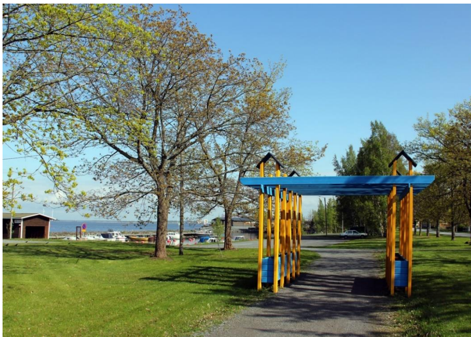
Kuva 8. Satamakadun varrella oleva rakennelma pystytettiin loma-asuntomessuille v. 2008.

Matkailijoita opastetaan saarelle Porin suunnasta Vt 2:ta pitkin ja pohjoisesta Vt 8:lta Saaristotien kautta pääasiassa kyltein, joissa lukee ”Meri-Pori”. Siksi Reposaarelle saapuminen kannattaa merkitä näkyvästi ”Tervetuloa Reposaarelle” taululla tai näyttävämmällä maamerkillä. Tällainen tervetuloa-toivotus sopii esim. Tahkoluodon risteyksestä noin. 200 m Reposaareen päin. Se voisi olla vaikkapa pyörätien yli rakennettu portti, jossa lukee ” Reposaari”. Portti voisi olla samantapainen puinen rakennelma kuin mitä on tehty Satamapuiston kevyen liikenteen väylälle tai sitten joku merihenkisen aiheen (esimerkiksi vene) ympärille luotu kokonaisuus.