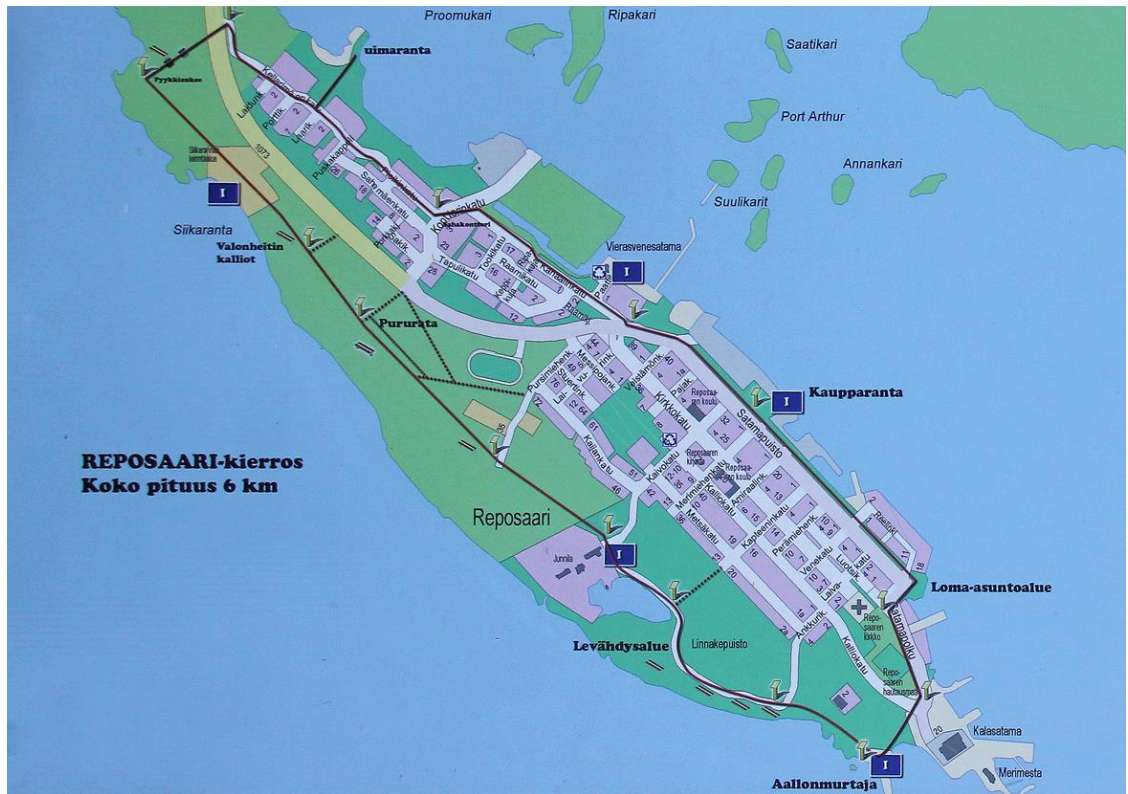
Kuva 7. Karttakuva Reposaaarikierroksesta