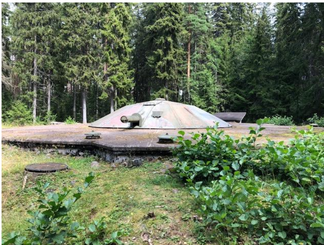
Kuva 12. Reposaarikierroksen varrelta voi metsän siimeksessä bongata Canet-tykin, jota ei löydy Linnakepuistosta. Tykistä kertova infotaulu oli kuitenkin hukassa.