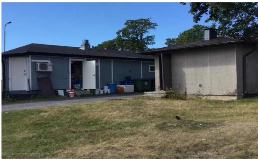
Kuva 13. Yleisö WC oikealla, kioskirakennuksen takana piilossa matkailijoilta.

Satamakadun kioskin takana sijaitsee saaren ainoa yleisö WC, joka on tarkoitettu myös matkailijoiden käyttöön. Sinne ei ole viitoitusta ja WC on huonokuntoinen. WC tulisi merkitä selvästi niin että matkailijat löytävät sen. Lisäksi WC tulisi remontoida täysin tai vaihtaa uuteen. Edullisimmaksi tulisi rakennuksen purku ja asentaa tilalle nykyaikainen kontti WC, joka verhoiltaisiin puurimoituksella Yyterin rannalla olevien konttien tapaan.