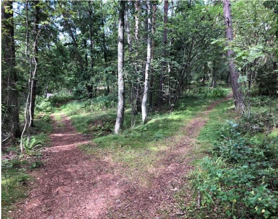
Kuva 10. Reposaaren reitin opasteviitat ovat metsäosuksilla hävinneet kokonaan.