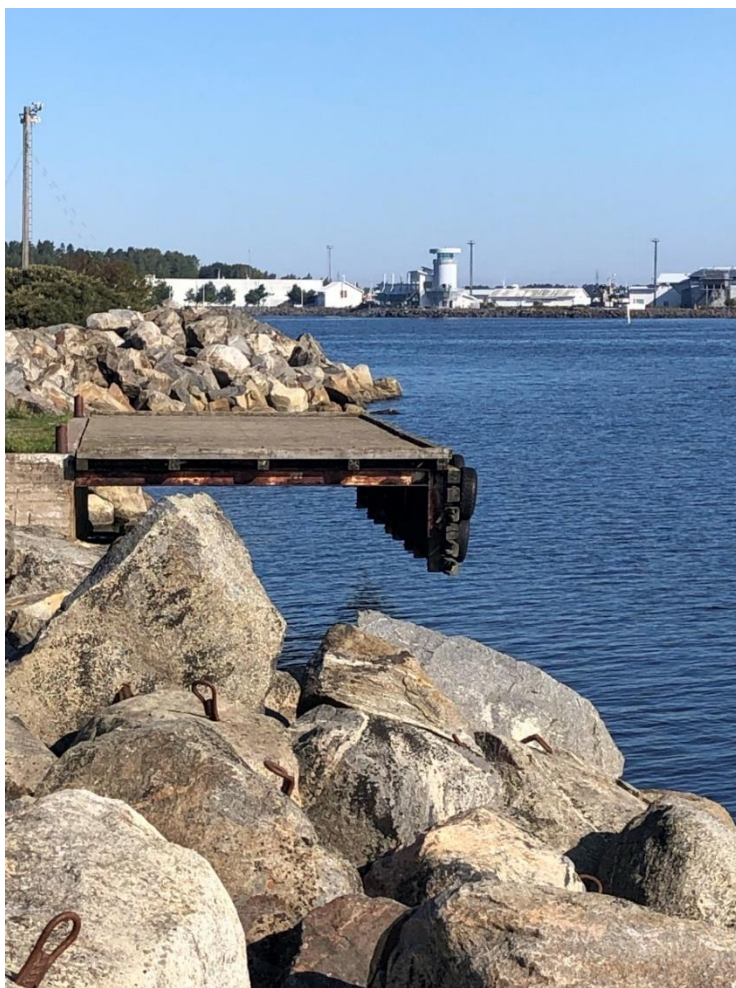
Kuva 14. Aallonmurtajalla sijaitseva vanha ja huonokuntoinen entinen luotsilaituri.

Kallon aallonmurtajan loppupäässä noin 400 m:n etäisyydellä Cafe Kallosta on vanha, huonokuntoinen luotsilaituri. Vesibussi Charlotta on satunnaisesti käyttänyt sitä tuodessaan matkailijoita Kalloon. Laituriin on kuitenkin erittäin vaikea kiinnittyä turvallisesti ja mairinnousu ja veneeseen astuminen ovat hankalia, jopa vaarallisia. Yhdysliikenteen kannalta olisi järkevää rakentaa aallonmurtajan alkupäähän uusi laituri. Tämä tulisi toteuttaa esteettömänä ja niin, että sitä voisivat käyttää sekä vesibussi että Kallo Reposaari – yhteysvene. Uuden laituri paikan vierelle olisi helppo järjestää myös pyöräparkki. Uusi laituri palvelisi tällöin BSF:n tilausravintolan että Cafe Kallon asiakkaita sekä Kallon virkistysalueelle tulijoita.