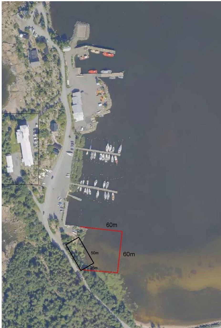
Kuva 6. BSF:n antamien mittojen mukaan piirretty täyttöalue.

vaihtoehdosta tulee kuitenkin luopua, sillä Rajavartiolaitoksen toimiminen alueella vaatii sen, että he voivat laajentaa satamatoimintoja tarvittavissa määrin esimerkiksi lisäämällä laituripaikkoja itäreunassa. Tällöin paras paikka uudelle aallonmurtajalle olisi ”Meritaito sataman” pohjoispuolella lähtien helikopterikentän kulmasta itään päin. Silloin aallonmurtaja suojaisi myös Rajavartiolaitoksen /luotsiveneiden laitureita. Toinen mahdollisuus, todennäköisesti kalliimpi, olisi jatkaa kiinteää ”Meritaitosatamassa” sijaitsevaa ns. kutterilaituria itään päin ja varustaa sen samanlaisella seinämärakenteella mitä nykyisessä laiturissa on.