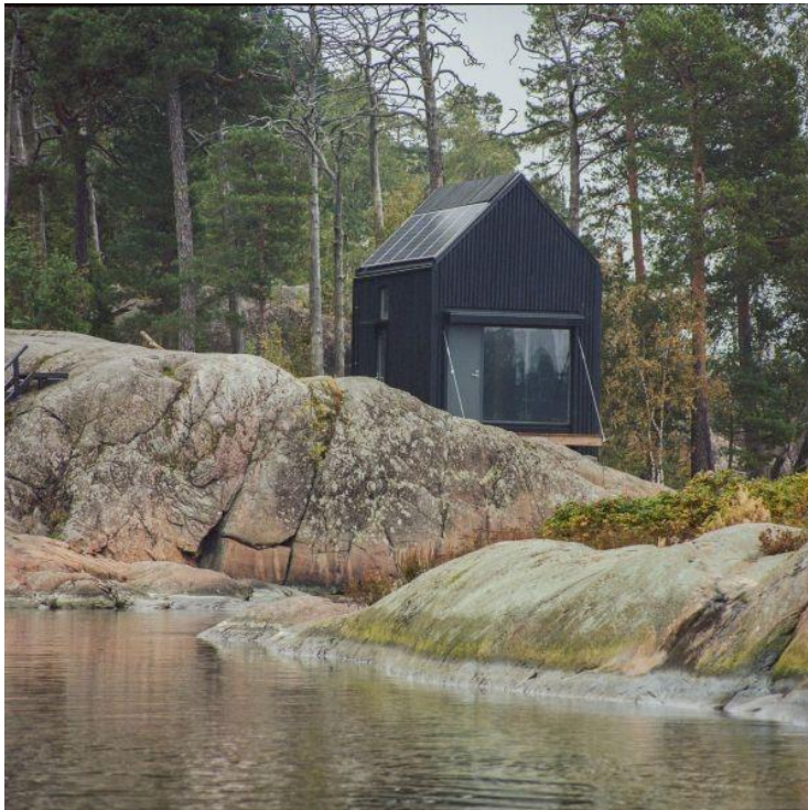
Kuva 4. Ekologinen, aurinkosähköä käyttävä siirrettävä Majamaja- mökki soveltuisi hyvin Kallon takarannan maisemaan

Kallon alueen historiaa ja ympäröivää merta ja merenkulkua voisi tuoda enemmän esille. Kallon alueelle kävelyreittien yhteyteen voisikin kehittää esimerkiksi meriaiheisen puiston, jossa voisi erilaisilla pisteillä olla itsenäisiä aktiviteetteja, kuten solmujen opettelua tai vaikka mahdollisuus lukea alueen sekä merenkulun historiasta. Tämän kaltaisessa hankkeessa pursiseura BSF olisi halukas tekemään yhteistyötä.