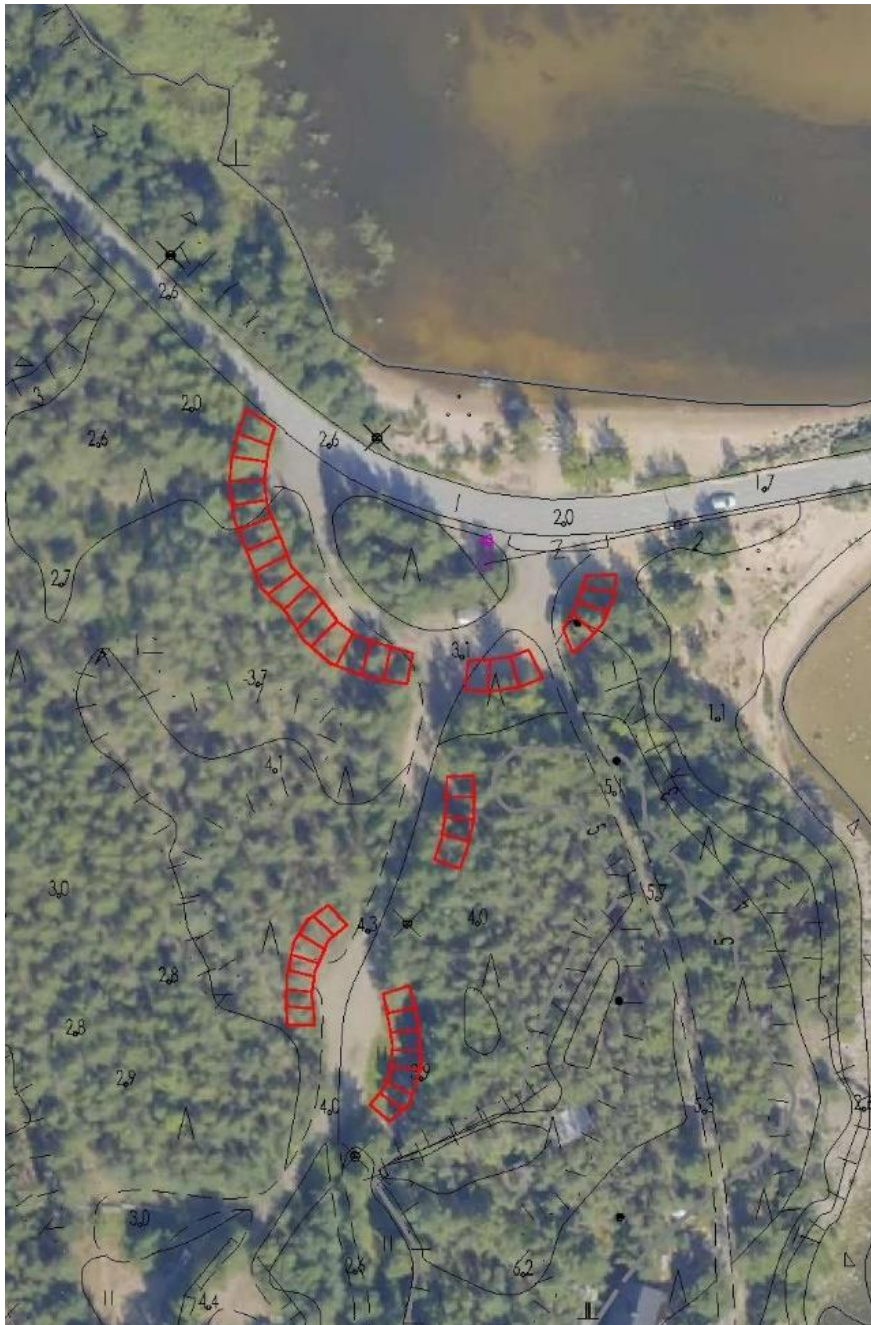
Kuva 2. Parkkipaikkoja saadaan alueelle helposti lisää raivaamalla nykyisiä "luvattomia" pysäköintialueita hieman laajemmiksi. Alueiden laajentaminen ei haittaa virkistyskäyttöä ja ne pystytään muotoilemaan hyvin maisemaan sopeutuviksi.

Kallon alueella käy paljon väkeä ja se onkin suosittu vierailukohde varsinkin kesäsesongin aikaan, joten parkkitila siellä on kysyttyä. Kallon alkupäässä on alueita, kuvassa 3. näkyvät numerot 1-4, joille mahtuisi pienellä raivaamisella noin 30-40 autoa.