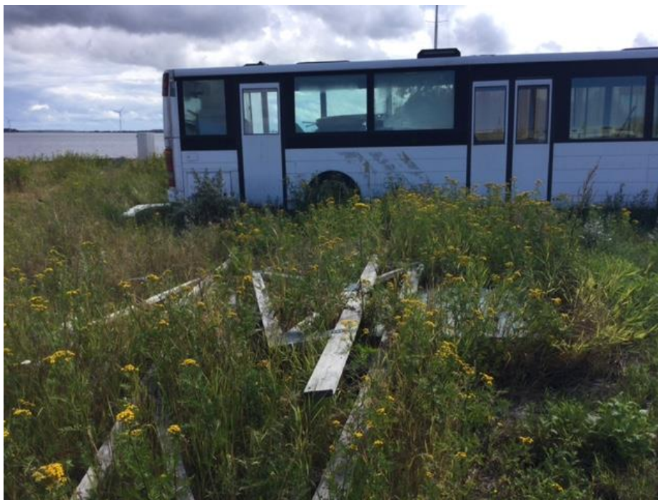
Kuva 9. Uusitun laiturin ympäristö tulisi siistiä.

on jo nyt varastoitu epämääräistä tavaraa ja mm. vanha linja-auto. Alue tulisi siistiä välittömästi ja poistaa sieltä luvattomat esineet (ja veneet?).