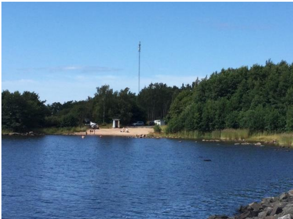
Kuva 14. Uimaranta

Reposaarella on vain yksi kunnollinen uimaranta, joka palvelee sekä matkailijoita että saaren asukkaita. Uimarannalla on paljon käyttäjiä, mutta se on melko pieni ja ahdas. Uimarannan laajentaminen onnistuisi melko helposti ja edullisesti poistamalla rannalta kasvillisuutta ja tuomalla sinne muutama kuorma hiekkaa. Samalla rannalla olevia kiviä tulisi poistaa tai siirtää sivuun.