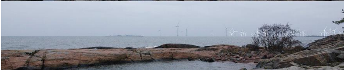
Kuva 1-4. Havainnekuva C Reposaaren leirintäalueelta syksyllä. Yläkuvan objektiivi on 24 mm ja keskimmäisen kuvan 50 mm. Alakuvassa on valkoisella osoitettu uudet voimalat. Lähimpään hankkeen tuulivoimalaan on etäisyyttä yli 7 kilometriä.