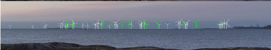
Kuva 1-2. Havainnekuva A Kallon rannalta. Yläkuvan objektiivi on 16 mm ja keskimmäisen kuvan 50 mm. Alhaalla on eroteltuna Tahkoluodon olemassa oleva merituulipuisto vihreällä sekä merituulipuiston laajenuksen voimalat valkoisella. Lähimpään hankkeen tuulivoimalaan on etäisyyttä yli 10 kilometriä.