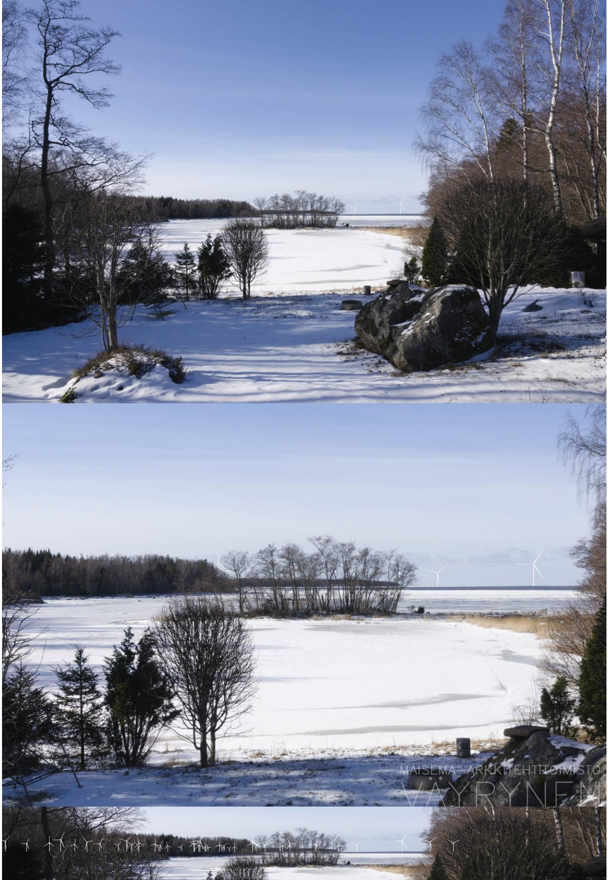
Kuva 1-16. Havainnekuva X kauniskovelosta. Yläkuvan objektiivi on 24 mm ja alakuvan 50 mm. Alakuvassa on valkoisella osoitettu uudet voimalat. Lähimpään hankkeen tuulivoimalaan on etäisyyttä yli 7 kilometriä.