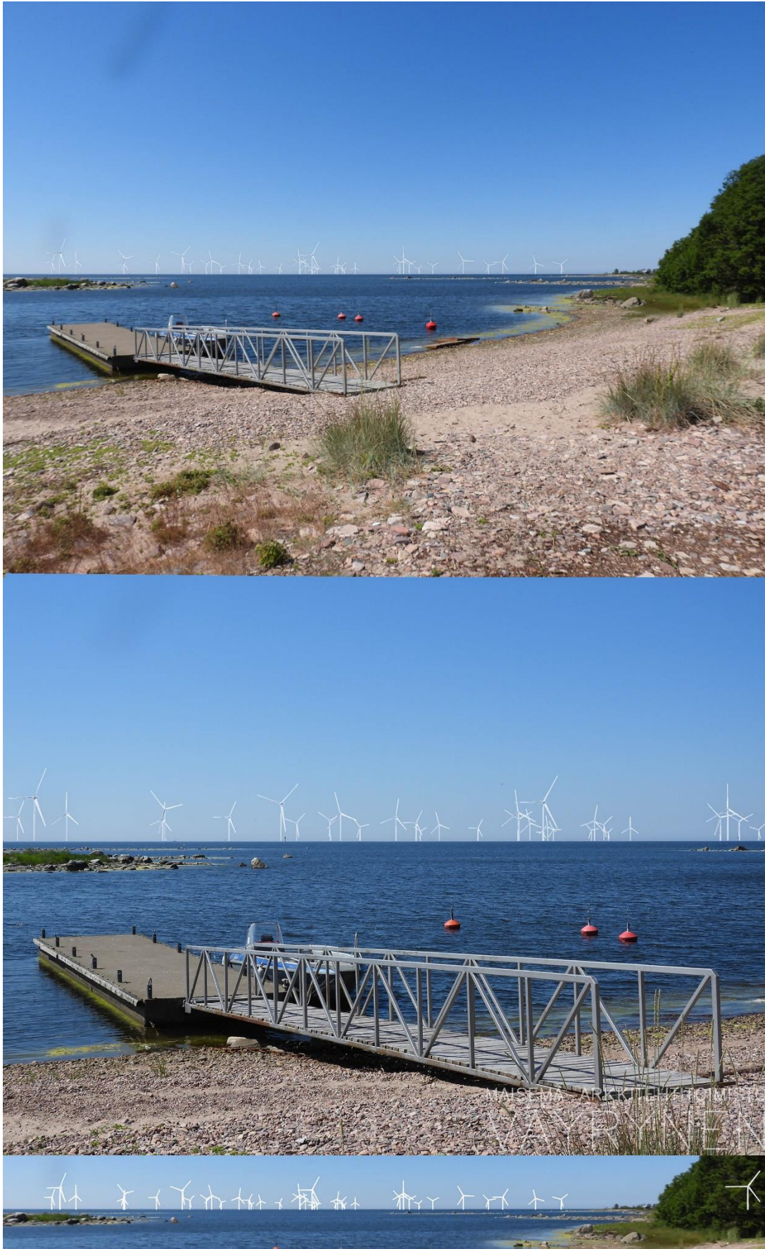
Kuva 1-5. Havainnekuva Q Iso Enskeristä. Kuvan objektiivi on 50 mm. Alakuvassa on valkoisella osoitettu uudet voimalat. Lähimpään hankkeen tuulivoimalaan on etäisyyttä noin 4,5 kilometriä.