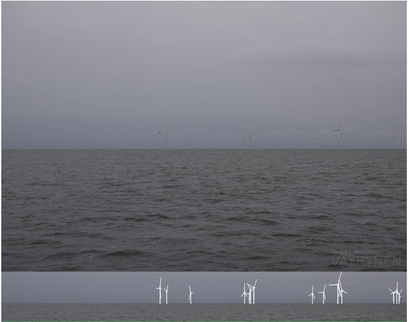
Kuva 1-12. Havainnekuva R Iso Silkkikarin Kumppoosista. Kuvan objektiivi on 50 mm. Alakuvassa on valkoisella osoitettu uudet voimalat. Lähimpään kuvassa näkyvään hankkeen tuulivoimalaan on etäisyyttä noin 5 kilometriä.