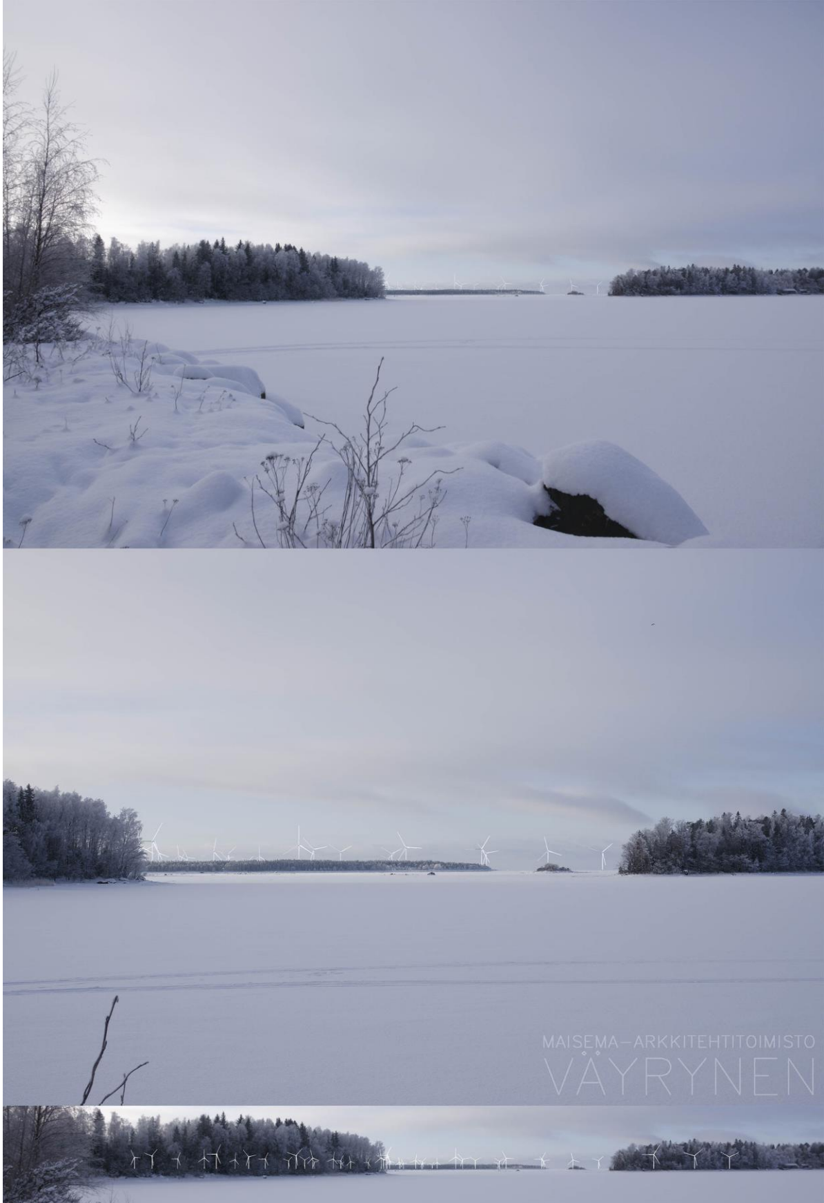
Kuva 1-15. Havainnekuva V Anttooran satamasta. Yläkuvan objektiivi on 24 mm ja alakuvan 50 mm. Alakuvassa on valkoisella osoitettu uudet voimalat. Lähimpään hankkeen tuulivoimalaan on etäisyyttä yli 7 kilometriä.