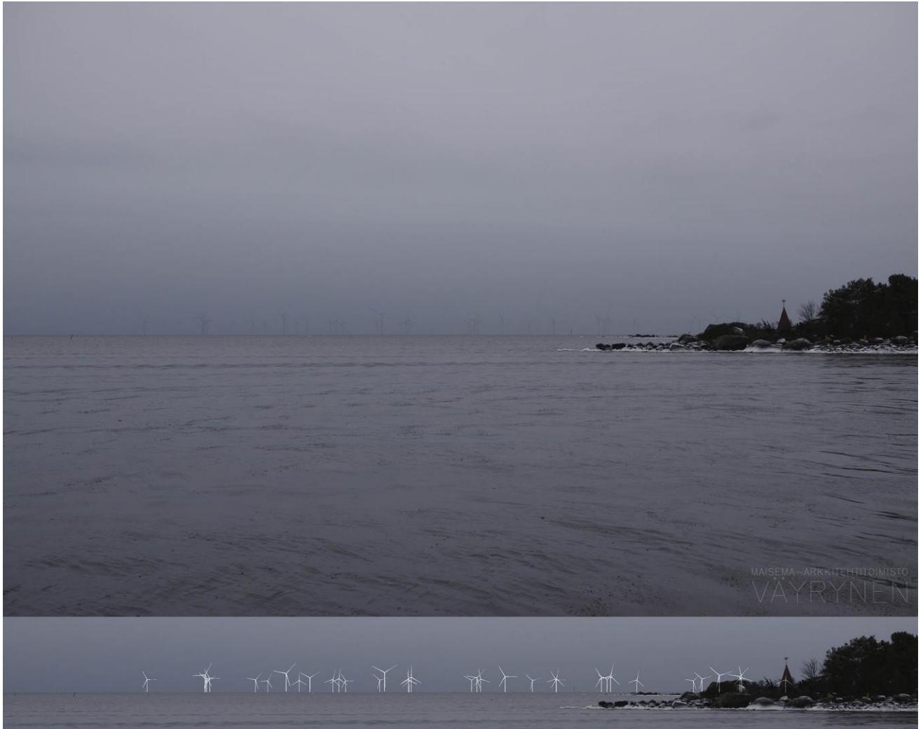
Kuva 1-13. Havainnekuva T Ouraluodosta. Kuvan objektiivi on 50 mm. Alakuvassa on valkoisella osoitettu uudet voimalat. Lähimpään hankkeen tuulivoimalaan on etäisyyttä noin 13 kilometriä.