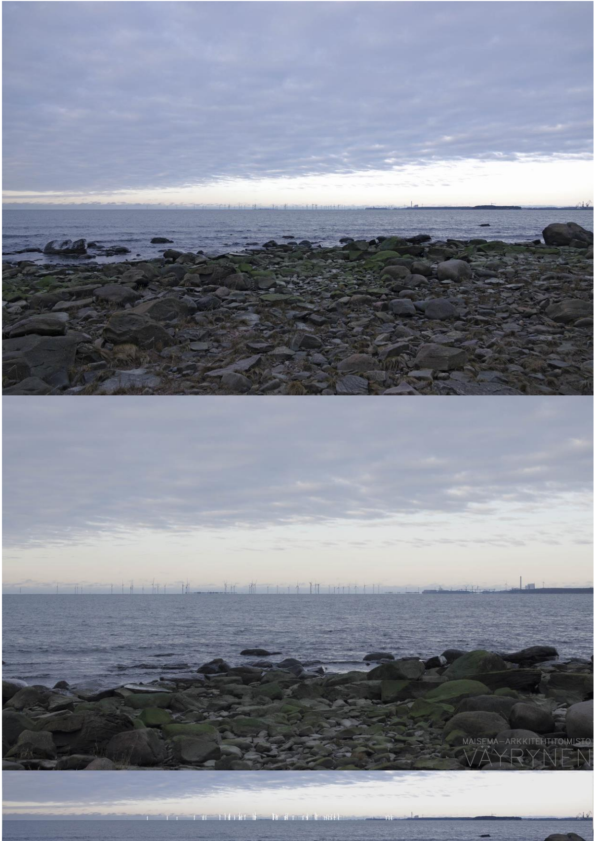
Kuva 1-8. Havainnekuva K Herrainpäivien niemen kärjestä. Yläkuvan objektiivi on 24 mm ja keskimmäisen kuvan 50 mm. Alakuvassa on valkoisella osoitettu uudet voimalat. Lähimpään hankkeen tuulivoimalaan on etäisyyttä lähes 13 kilometriä.