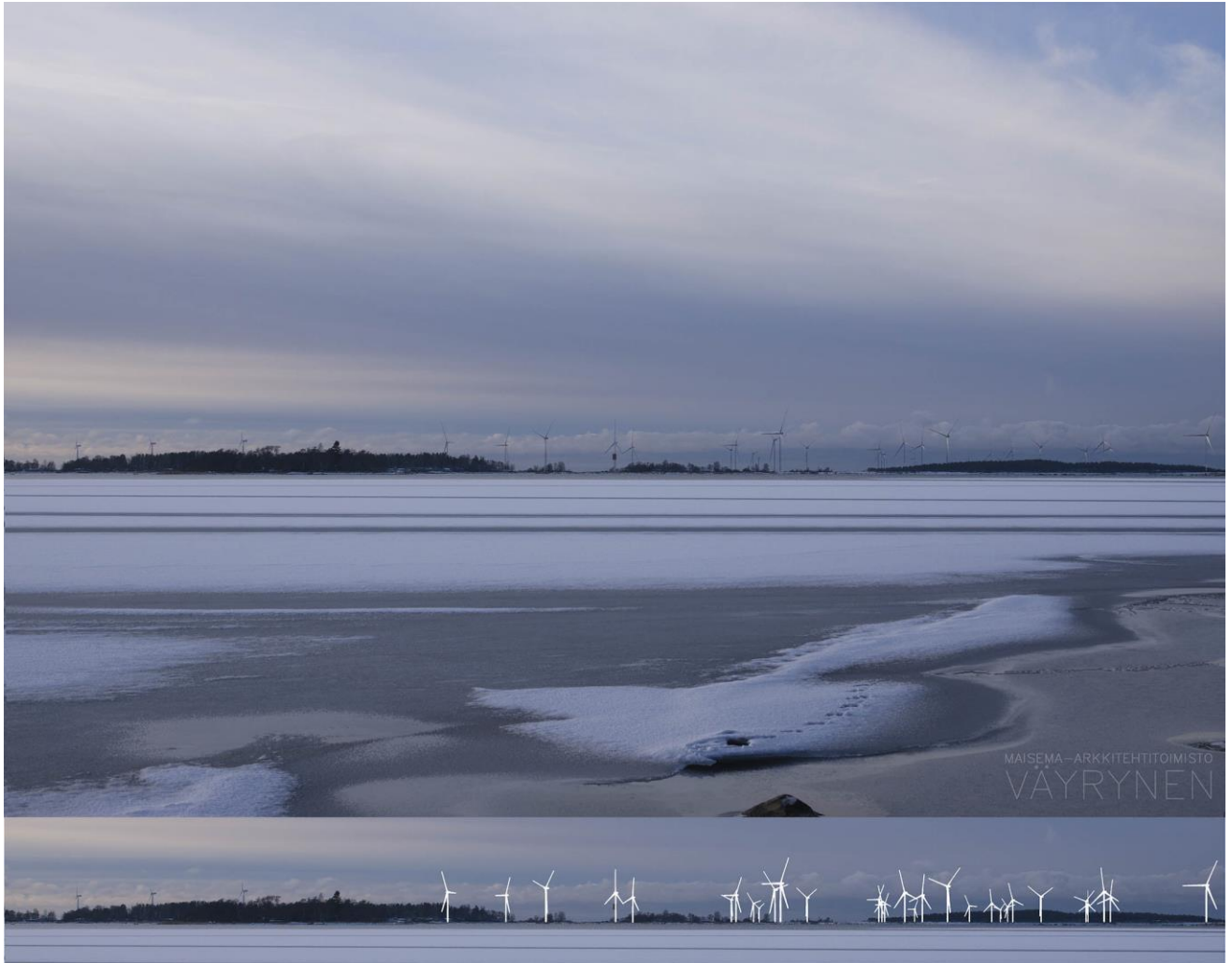
Kuva 1-10. Havainnekuva P Anttooran Pastuskeristä. Kuvan objektiivi on 50 mm. Alakuvassa on valkoisella osoitettu uudet voimalat. Lähimpään hankkeen tuulivoimalaan on etäisyyttä yli 7 kilometriä.