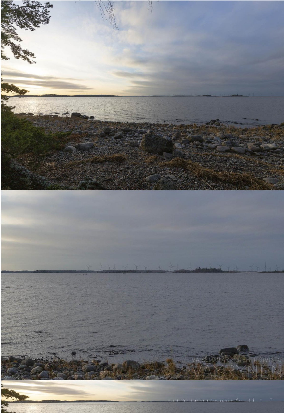
Kuva 1-6. Havainnekuva G Santeen luonnonsuojelualueelta. Yläkuvan objektiivi on 16 mm ja alakuvan 50 mm. Alakuvassa on valkoisella osoitettu uudet voimalat. Lähimpään hankkeen tuulivoimalaan on etäisyyttä yli 11 kilometriä.