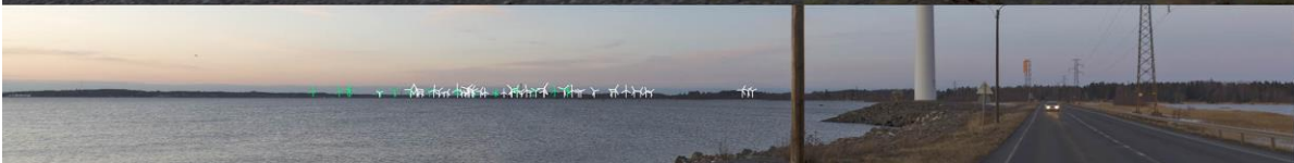
Kuva 1-9. Havainnekuva L Reposaaressa maantieltä. Yläkuvan objektiivi on 16 mm ja alakuvan 50 mm. Alhaalla on valkoisella osoitettu uudet voimalat ja vihreällä olemassa olevat Tahkoluodon merituulipuiston voimalat. Lähimpään hankkeen tuulivoimalaan on etäisyyttä yli 11 kilometriä.