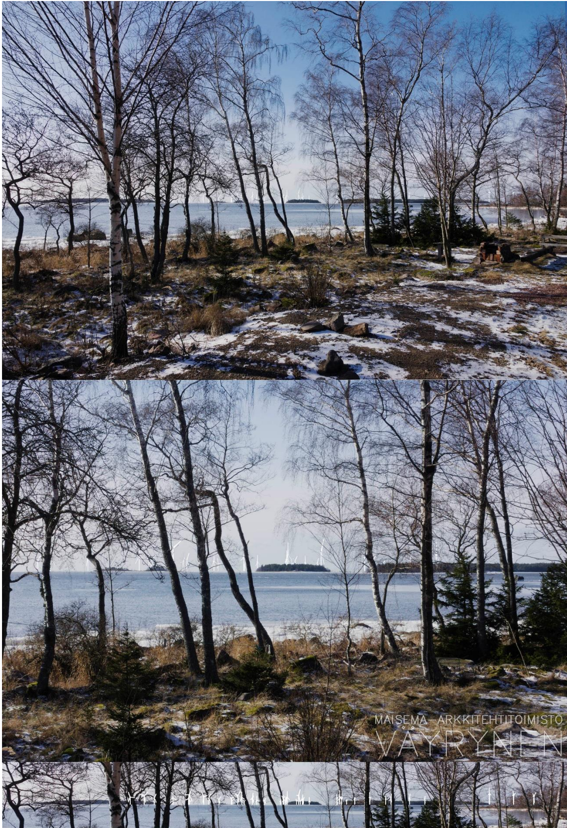
Kuva 1-18. Havainnekuva ZAnttooran Perttelholmasta. Yläkuvan objektiivi on 24 mm ja alakuvan 50 mm. Alakuvassa on valkoisella osoitettu uudet voimalat. Lähimpään hankkeen tuulivoimalaan on etäisyyttä yli 7 kilometriä.