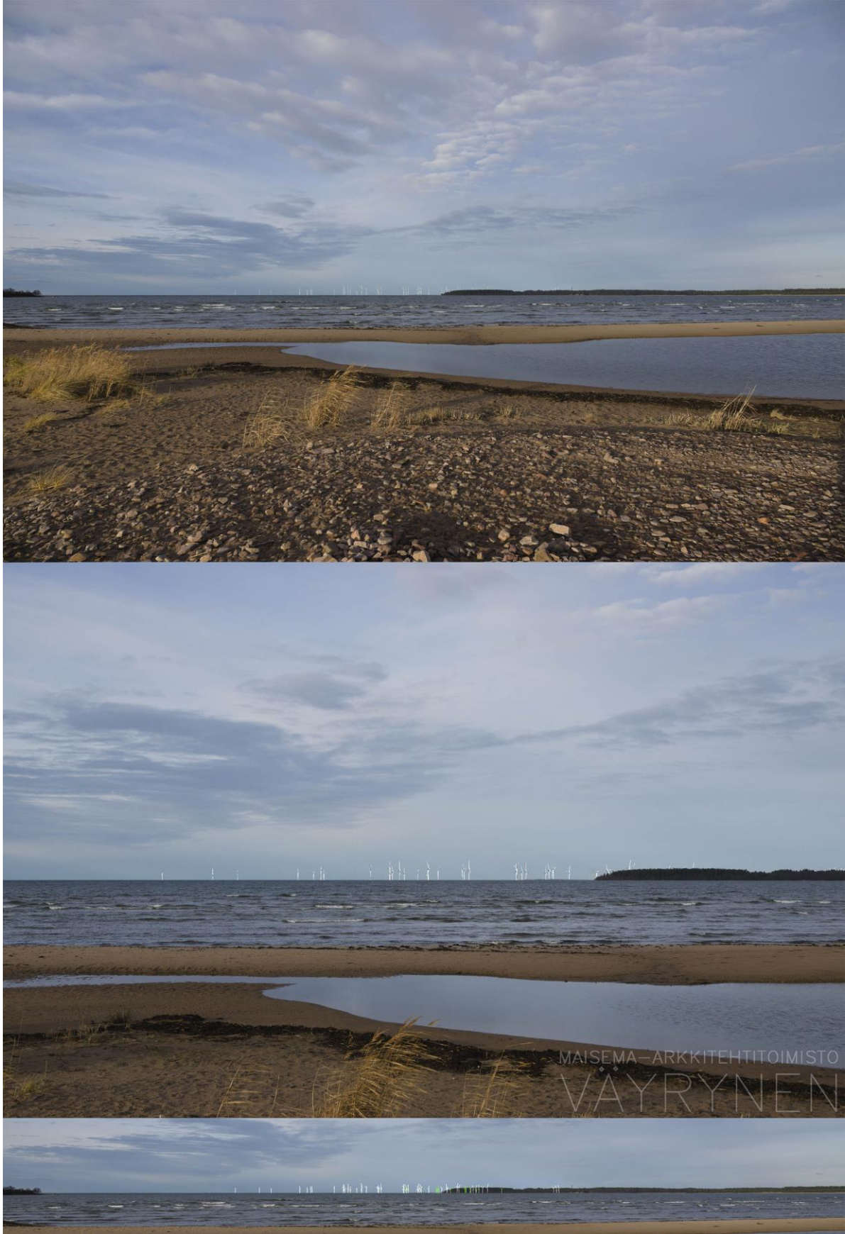
Kuva 1-14. Havainnekuva U Yyterin Munakarinsäikältä. Yläkuvan objektiivi on 24 mm ja keskimmäisen kuvan 50 mm. Alhaalla on valkoisella osoitettu uudet voimalat ja vihreällä olemassa olevat Tahkoluodon merituulipuiston voimalat. Lähimpään hankkeen tuulivoimalaan on etäisyyttä 16 kilometriä.