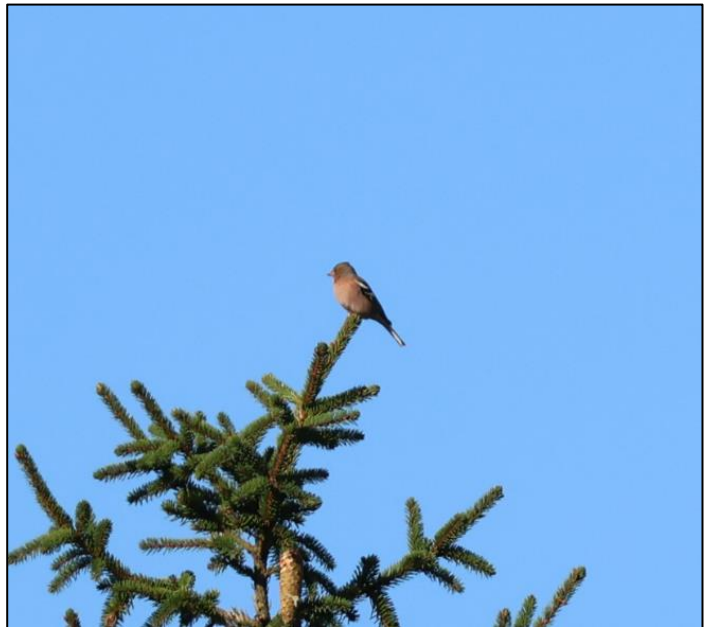
Kuva 9. Peippoparvia esiintyi runsaasti, tämä yksilö istui kuusen latvassa havaintopisteen 1 lähistöllä. Juhani Grönroos

Tuulihaukka ( Falco tinnunculus ), nuolihaukka ( Falco subbuteo ) ja ampuhaukka ( Falco columbarius ) todettiin vuoden 2014 kaakkuri- ja petolintuseurannassa täysin satunnaisiksi läpilentäjiksi. Syksyjen 2023 ja 2024 maastoretkipäivinä ei lajeista tehty havaintoja selvitysalueella ja Tiira-tietokannan (Tiira.fi) harvat havainnot tukevat tätä oletusta edelleen. Muut päiväpetolintulajit eivät ole levinneisyydeltään selvitysalueelle tyypillisiä, eikä niitä syksyn havaintoretkillä myöskään tavattu.