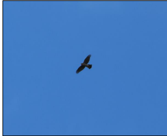
Kuva 7. Kanahaukka kiertelemässä havaintopisteeseen 5 yläpuolella. Juhani Grönroos

Syksyn 2024 kolmena maastoretkipäivänä ei lajista tehty havaintoja selvitysalueella, mutta havaintopisteellä 5, alueen ulkopuolella, havaittiin lajin yksilö kiertelemässä (kuva 7. ). Tiira-tietokantaan (Tiira.fi) oli tallennettu yksi paikallinen havainto selvitysalueelta, kuten vuoden 2023 selvityksessä.