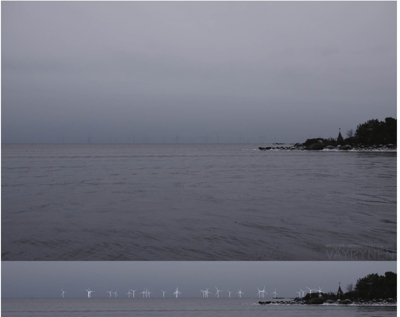
Kuva 1-15. Havainnekuva T Ouraluodosta. Kuvan objektiivi on 50 mm. Alakuvassa on valkoisella osoitettuu uudet voimalat. Lähimpään hankkeen tuulivoimalaan on etäisyyttä 15 kilometriä.