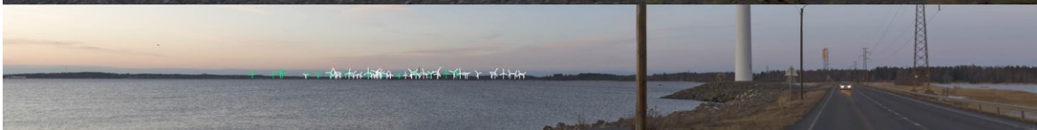
Kuva 1-9. Havainnekuva L Reposaaaren maantieltä. Yläkuvan objektiivi on 16 mm ja alakuvan 50 mm. Alhaalla on valkoisella osoitettu uudet voimalat ja vihreällä olemassa olevat Tahkoluodon merituulipuiston voimalat. Lähimpään hankkeen tuulivoimalaan on etäisyyttä yli 11 kilometriä. Kuvan ottamisen jälkeen, tien vieressä oleva lähin voimala on poistettu.