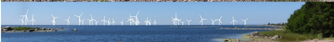
Kuva 1-12. Havainnekuva Q Iso Enskeristä. Kuvan objektiivi on 50 mm. Alakuvassa on valkoisella osoitettu uudet voimalat. Lähimpään hankkeen tuulivoimalaan on etäisyyttä noin 4,5 kilometriä.