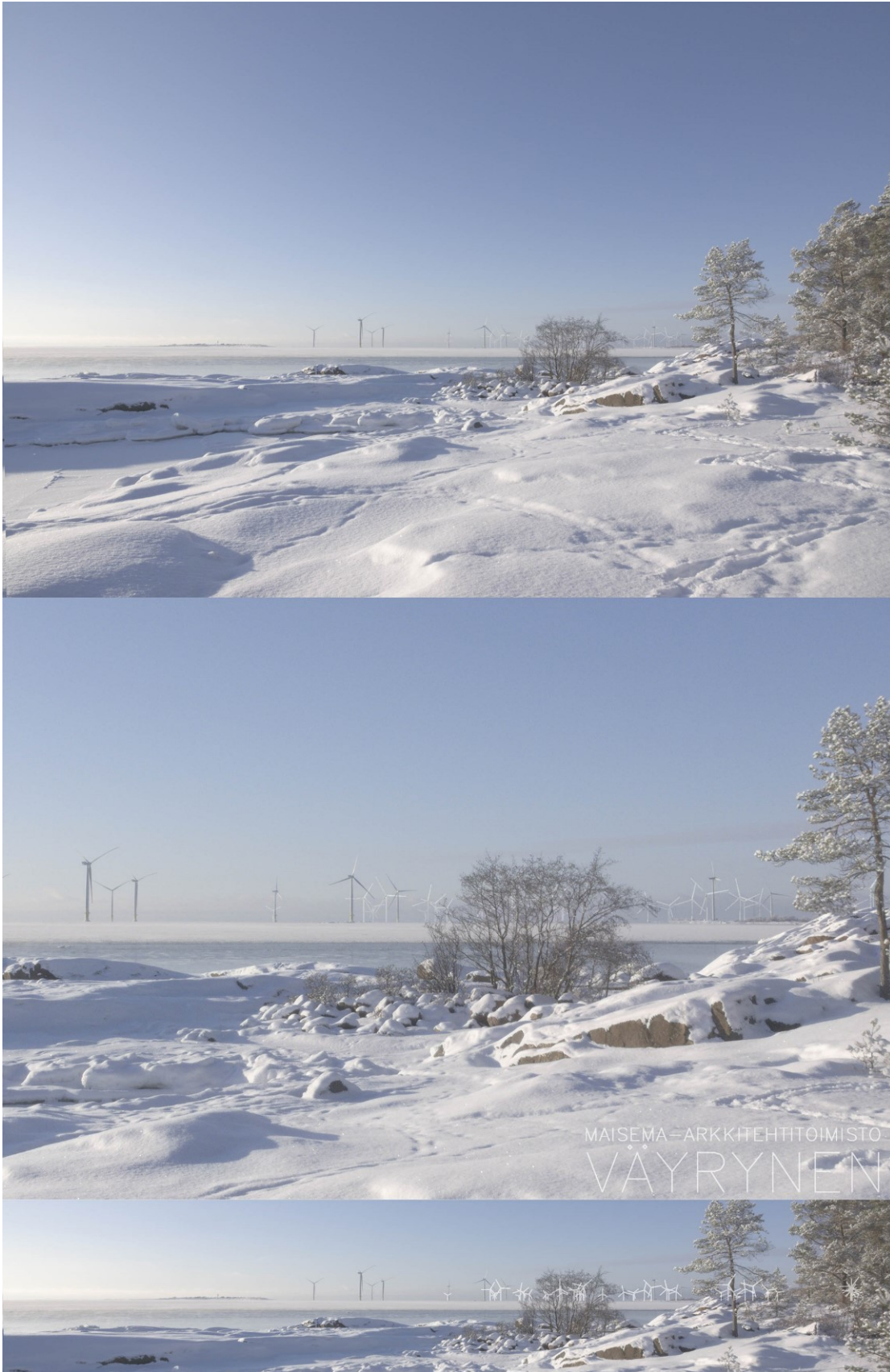
Kuva 1-4. Havainnekuva C Reposaaaren leirintäalueelta talvella. Yläkuvan objektiivi on 24 mm ja keskimmäisen kuvan 50 mm. Alakuvaan on valkoisella merkitty uudet voimalat. Lähimpään hankkeen tuulivoimalaan on etäisyyttä yli 7 kilometriä.