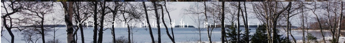
Kuva 1-20. Havainnekuva Z. Anttooran Perttelholmasta. Yläkuvan objektiivi on 24 mm ja alakuvan 50 mm. Alakuvassa on valkoisella osoitettu uudet voimalat. Lähimpään hankkeen tuulivoimalaan on etäisyyttä yli 7 kilometriä.