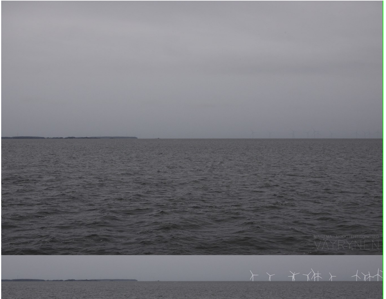
Kuva 1-14. Havainnekuva S Revelistä. Kuvan objektiivi on 50mm. Alakuvassa on valkoisella osoitettu uudet voimalat. Lähimpään hankkeen tuulivoimalaan on etäisyyttä yli 7 kilometriä.