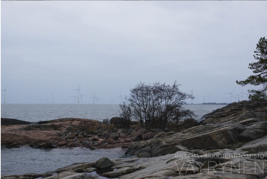
Kuva 1-4. Havainnekuva C Reposaaren leirintäalueelta syksyllä. Yläkuvan objektiivi on 24 mm ja keskimmäisen kuvan 50 mm. Alakuvassa on valkoisella osoitettu uudet voimalat. Lähimpään hankkeen tuulivoimalaan on etäisyyttä yli 7 kilometriä.