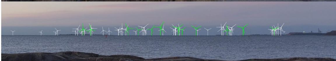
Kuva 1-2. Havainnekuva A Kallon rannalta. Yläkuvan objektiivi on 16 mm ja keskimmäisen kuvan 50 mm. Alhaalla on eroteltuna Tahkoluodon olemassa oleva merituulipuisto vihreällä sekä merituulipuiston laajenuksen voimalat valkoisella. Lähimpään hankkeen tuulivoimalaan on etäisyyttä yli 10 kilometriä.