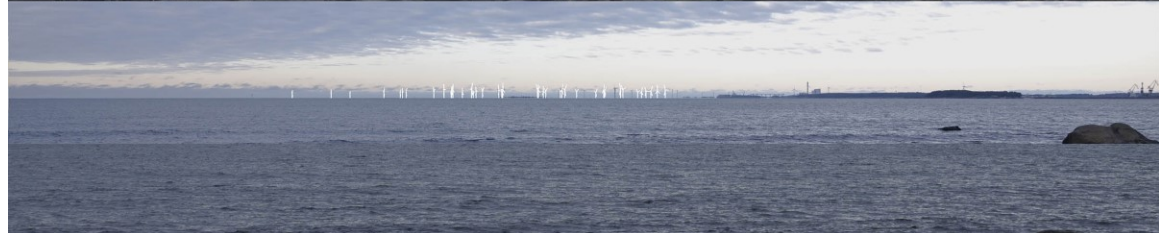
Kuva 1-8. Havainnekuva K Herrainpäivien niemen kärjestä. Yläkuvan objektiivi on 24 mm ja keskimmäisen kuvan 50 mm. Alakuvassa on valkoisella osoitettu uudet voimalat. Lähimpään hankkeen tuulivoimalaan on etäisyyttä lähes 13 kilometriä.