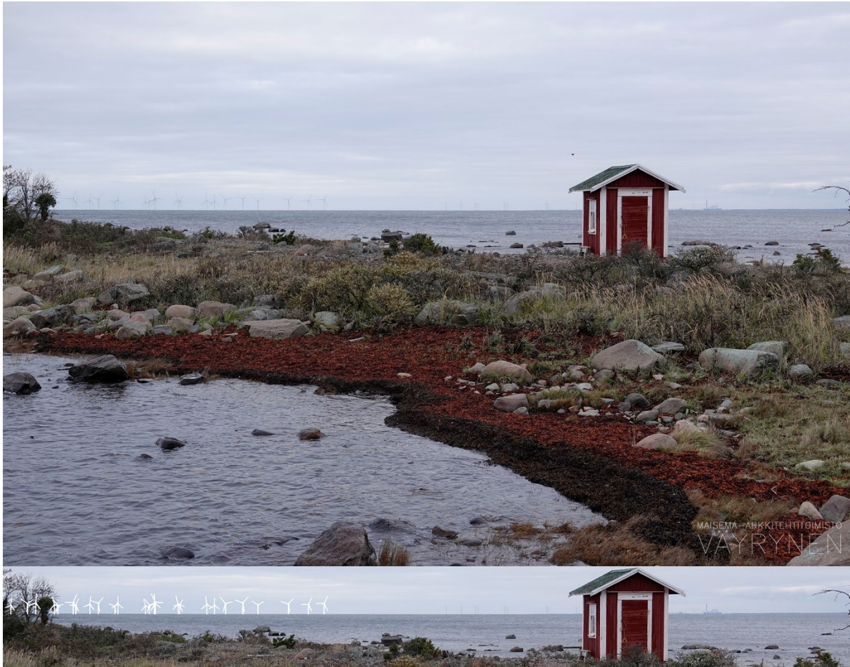
Kuva 1-10. Havainnekuva N Säpistä. Kuvan objektiivi on 50mm. Alakuvassa on valkoisella osoitettu uudet voimalat. Lähimpään hankkeen tuulivoimalaan on etäisyyttä lähes 18 kilometriä.