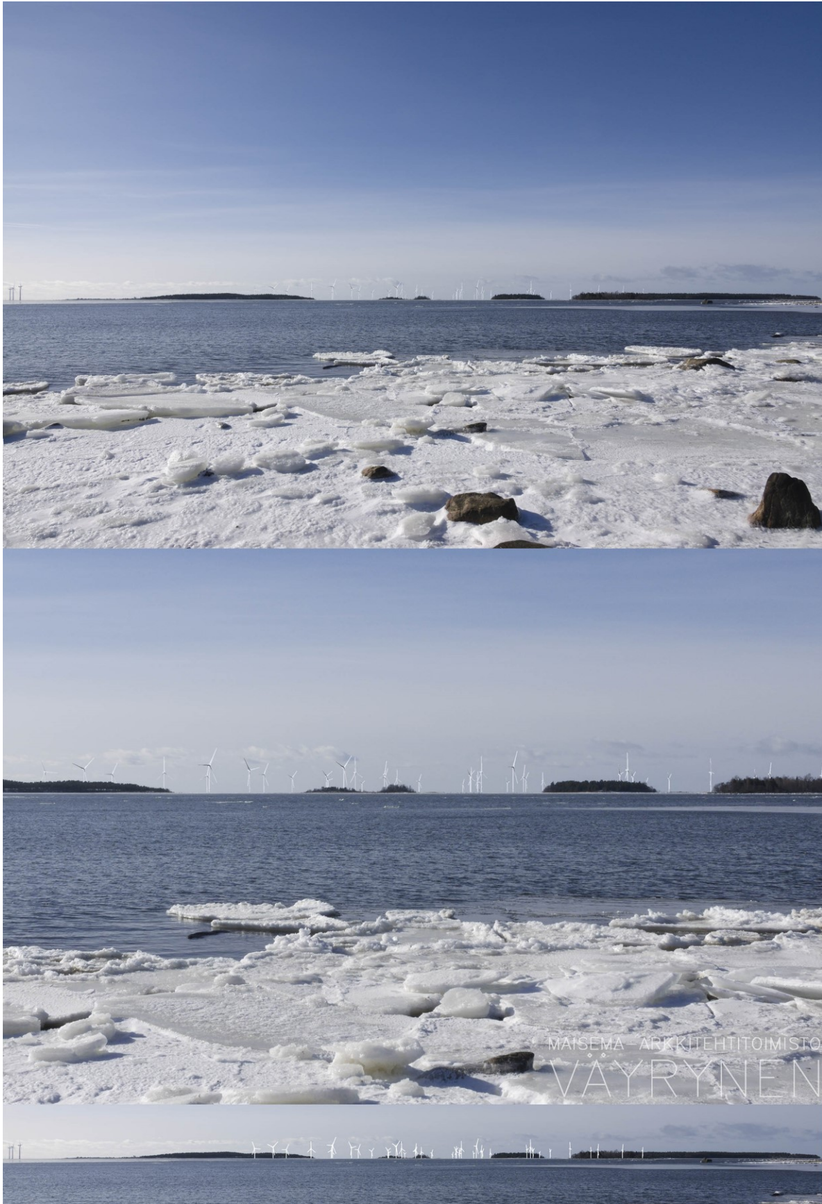
Kuva 1-19. Havainnekuva Y Anttooran Perttelholman rannasta. Yläkuvan objektiivi on 24 mm ja alakuvan 50 mm. Alakuvassa on valkoisella osoitettu uudet voimalat. Lähimpään hankkeen tuulivoimalaan on etäisyyttä yli 7 kilometriä.