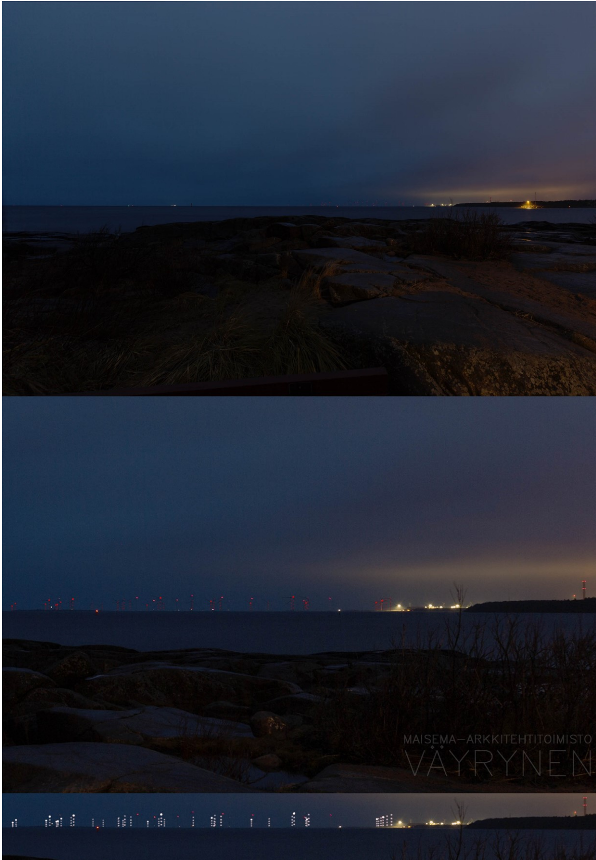
Kuva 1-3. Havainnekuva A Kallosta yöllä. Kuvassa näkyy hankkeen lentoestevalot. Yläkuvan objektiivi on 16 mm ja keskimmäisen kuvan 50 mm. Alakuvaan on valkoisella merkitty hankkeen valojen sijainnit. Lähimpään hankkeen tuulivoimalaan on etäisyyttä yli 10 kilometriä.