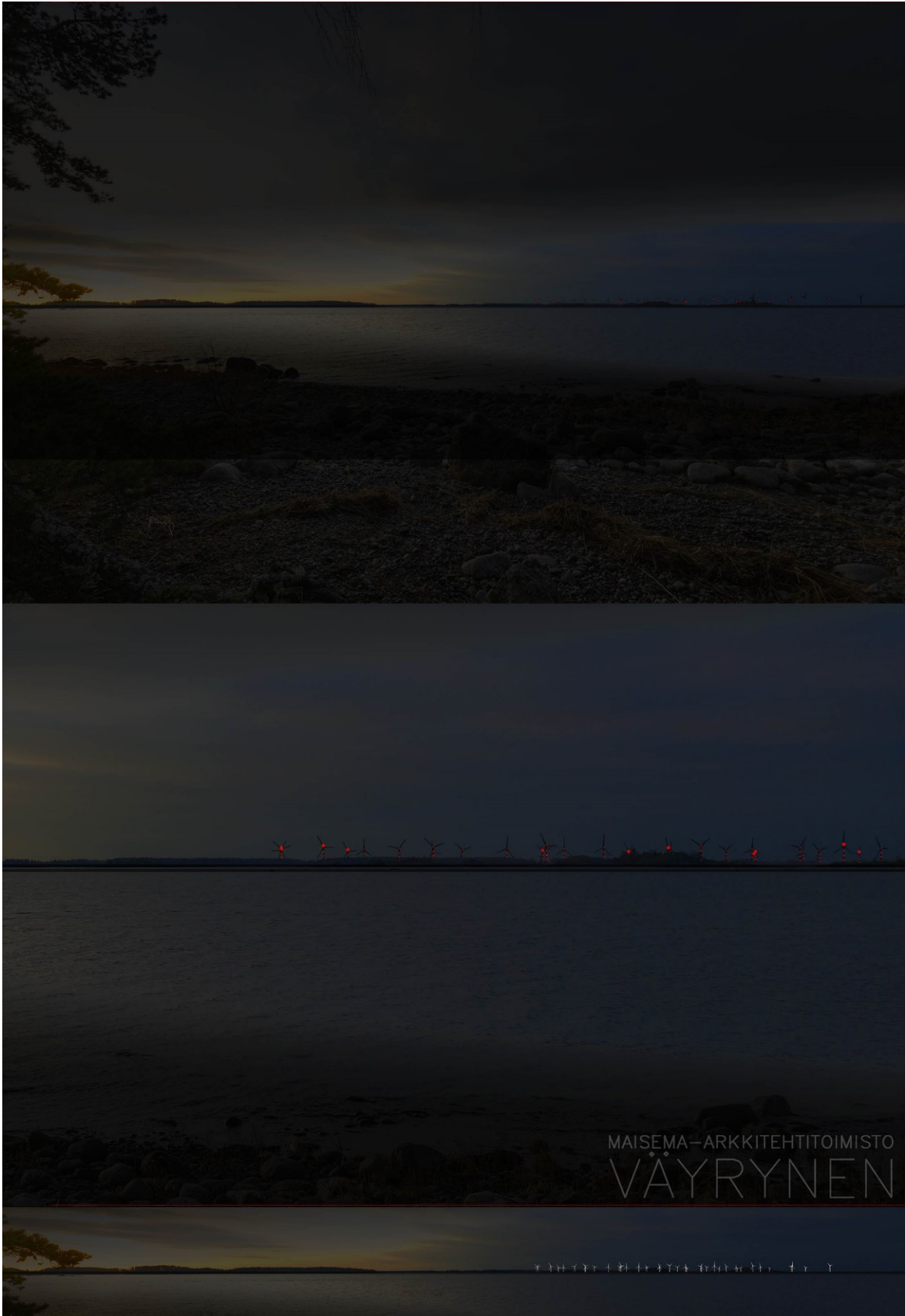
Kuva 1-7. Havainnekuva G Santeen luonnonsuojelualueelta pimeään vuorokaudenaikaan. Yläkuvan objektiivi on 16 mm ja keskimmäisen kuvan 50 mm. Alakuvassa on valkoisella osoitettu uudet voimalat. Lähimpään hankkeen tuulivoimalaan on etäisyyttä noin 13 kilometriä.