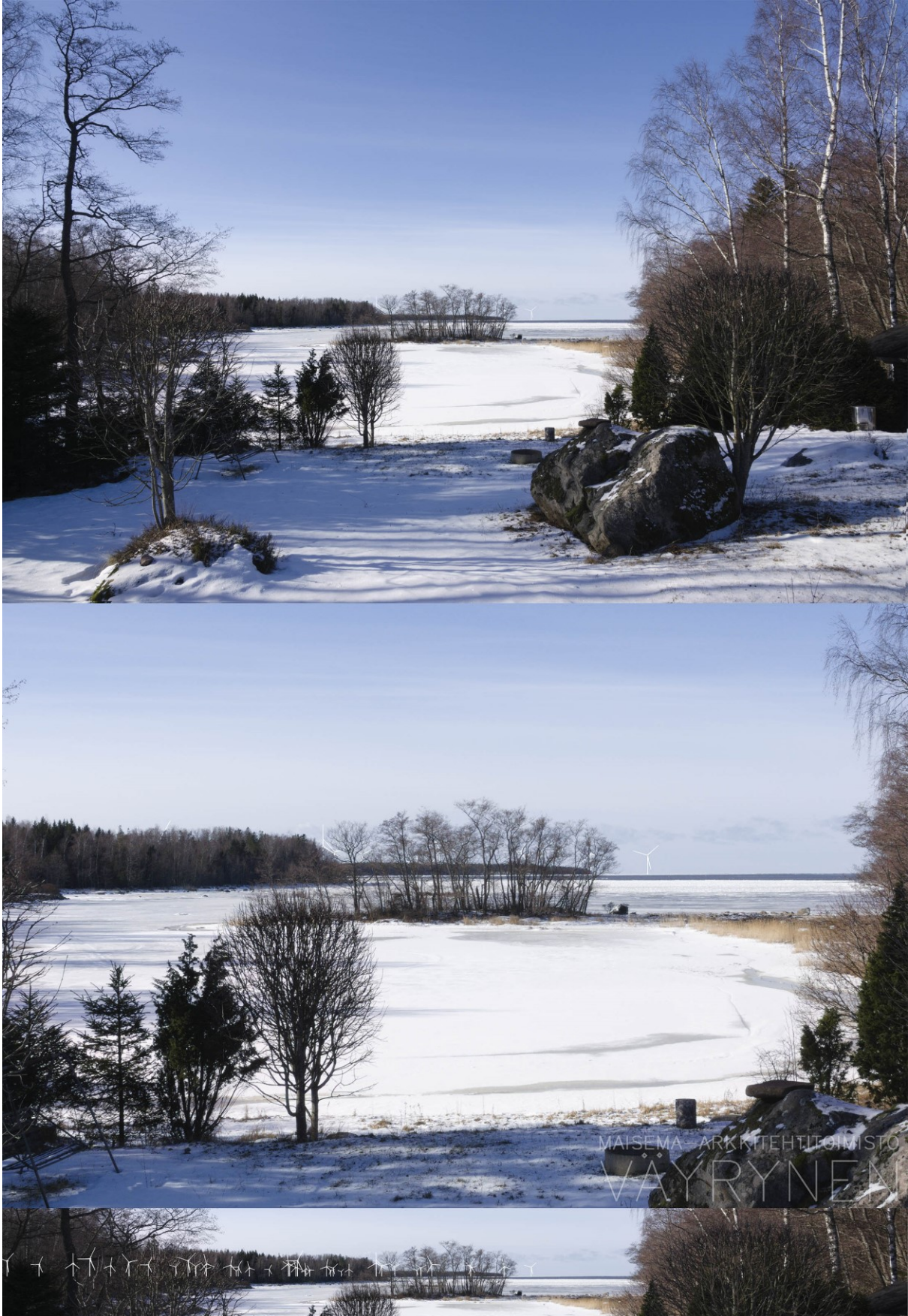
Kuva 1-18. Havainnekuva X kauniskovelosta. Yläkuvan objektiivi on 24 mm ja alakuvan 50 mm. Alakuvassa on valkoisella osoitettu uudet voimalat. Lähimpään hankkeen tuulivoimalaan on etäisyyttä yli 7 kilometriä.