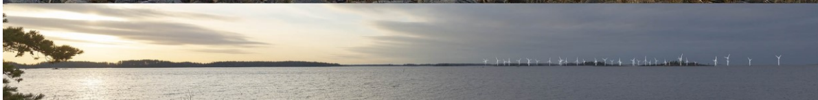
Kuva 1-6. Havainnekuva G Santeen luonnonsuojelualueelta. Yläkuvan objektiivi on 16 mm ja alakuvan 50 mm. Alakuvassa on valkoisella osoitettu uudet voimalat. Lähimpään hankkeen tuulivoimalaan on etäisyyttä noin 13 kilometriä.