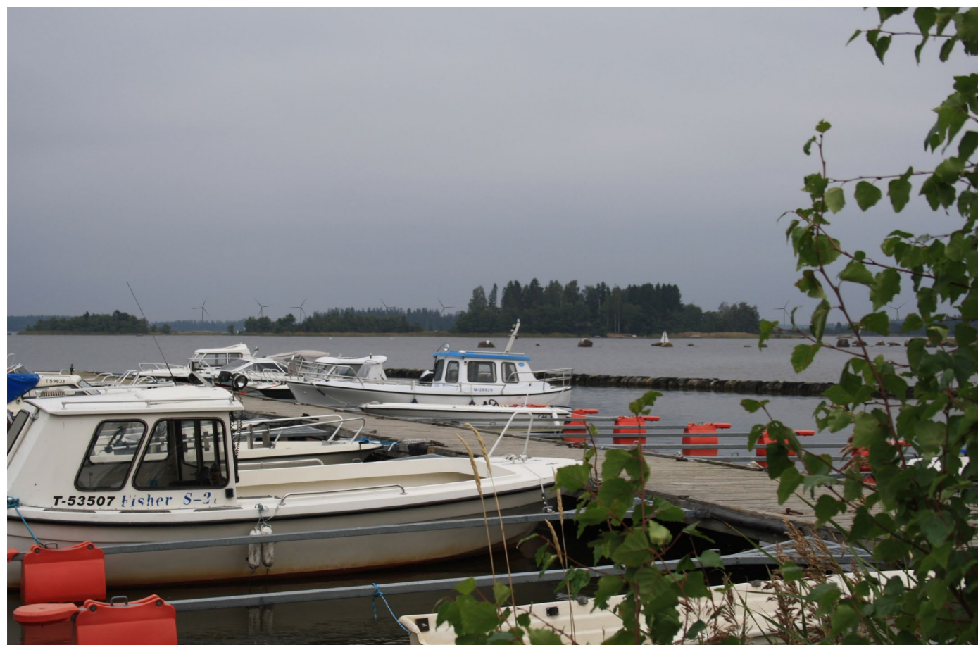
Kuvauspiste I. Kuvasovite Pastukerista. Kuvattu 59 mm polttovälillä. Etäisyys lähimpään tuulivoimalaan 12,1 km. Voimaloiden kokonaiskorkeus 250 m.