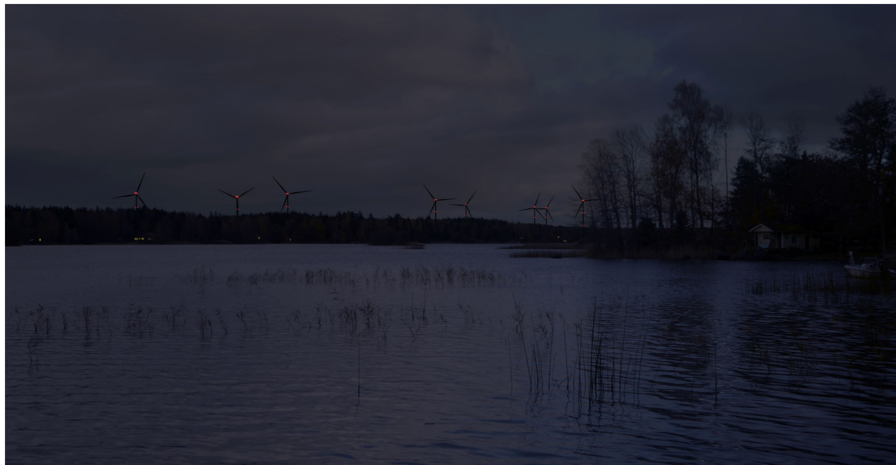
Kuvauspiste D. Kuvasovite Keikveden rannalta. Lentoestevalot. Muokattu valokuva, kuvattu 57 mm polttovälillä. Etäisyys lähimpään tuulivoimalaan 4,2 km. 14 voimalaa, kokonaiskorkeus 250 m.