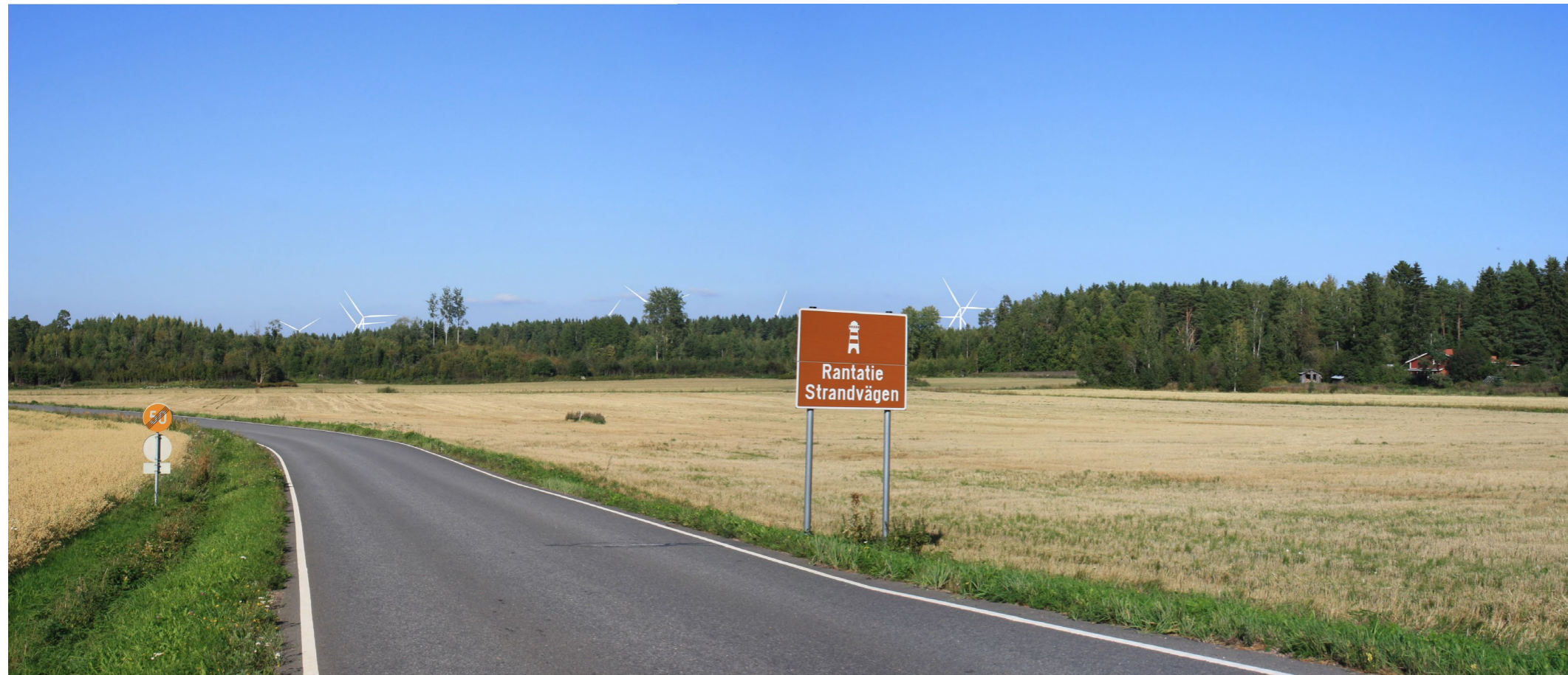
Kuvauspiste F. Kuvasovite Merikarvian rantatieltä. Koostettu panorama, kuvattu 53 mm polttovälillä. Etäisyys lähimpään tuulivoimalaan 3,6km. 14 tuulivoimalaa, kokonaiskorkeus 250 m.