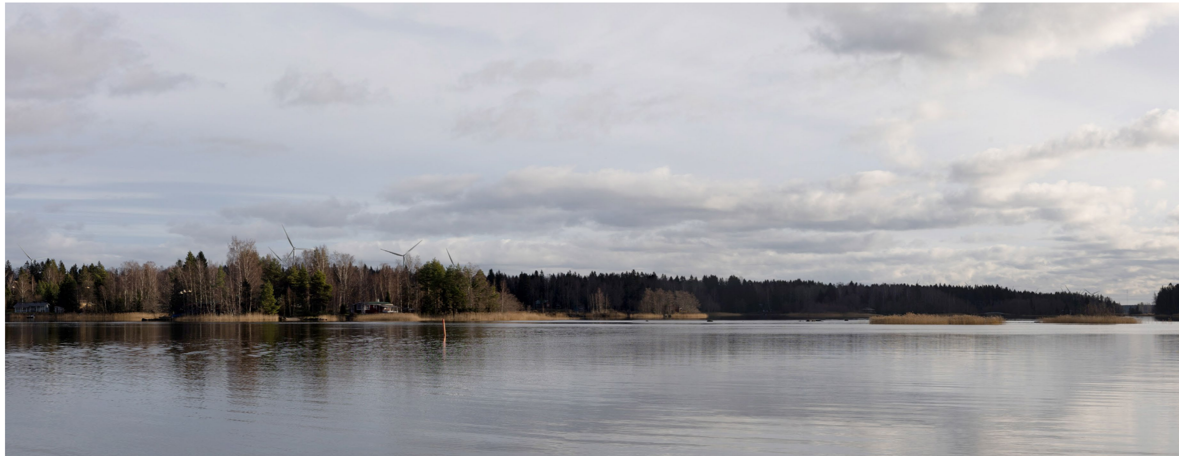
Kuvauspiste K. Kuvasovite yhteisvaikutuksista suunnitellun Köörtilän tuulivoimapuiston kanssa Sälttöön Iso-Viikilästä. Koostettu panorama, kuvattu 50 mm polttovälillä. Etäisyys lähimpään Köörtilän tuulivoimalaan 2,9 km ja 9,6km lähimpään Lammin tuulivoimalaan . Voimaloiden kokonaiskorkeus Köörtilä 210 m ja Lammi 250 m.