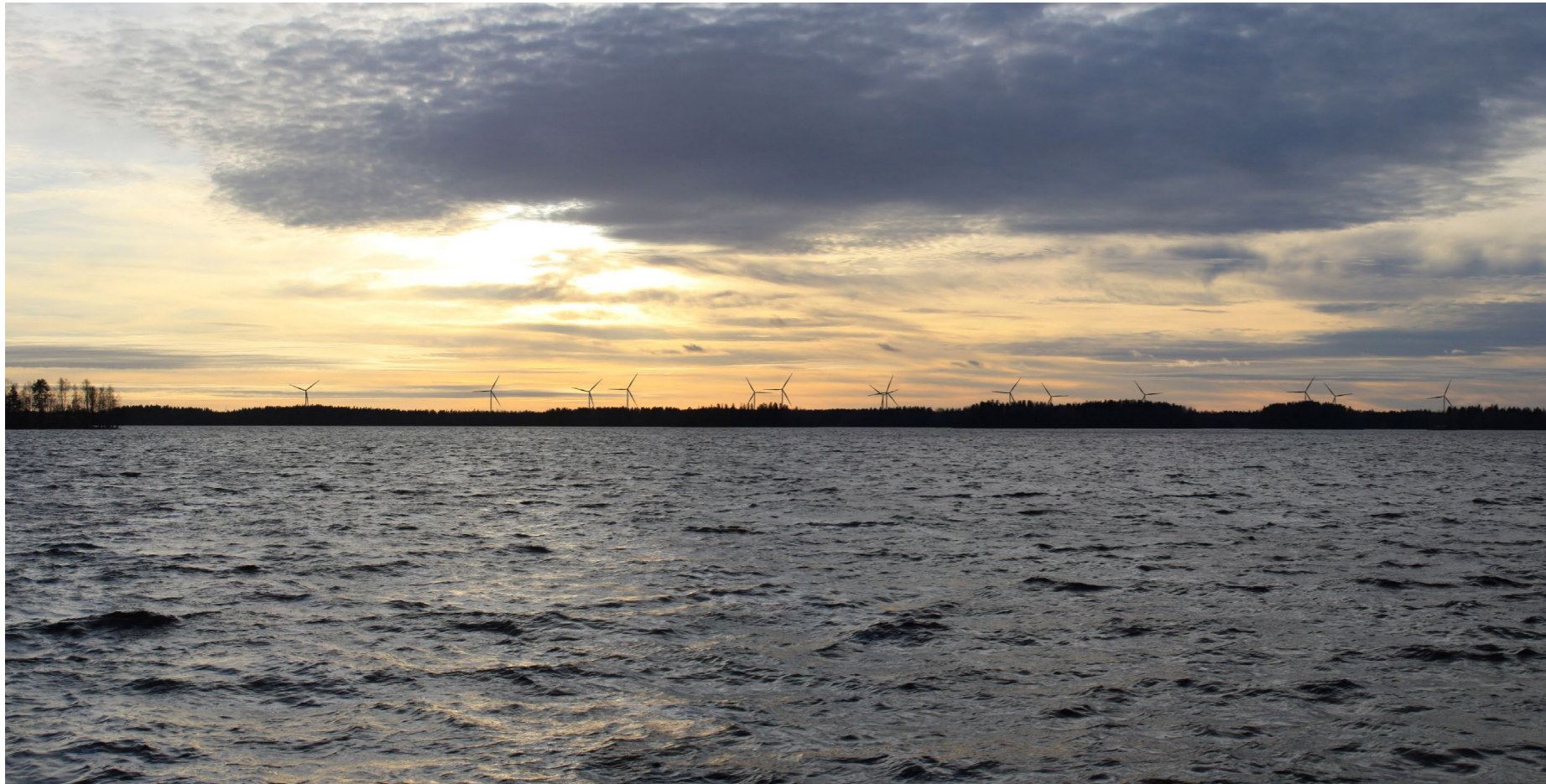
Kuvauspiste E. Kuvasovite iso-Kolkan kärjestä Isojärveltä. Koostettu panorama, kuvattu 51 mm polttovälillä. Etäisyys lähimpään tuulivoimalaan 8,5 km. 14 tuulivoimalaa, kokonaiskorkeus 250 m.