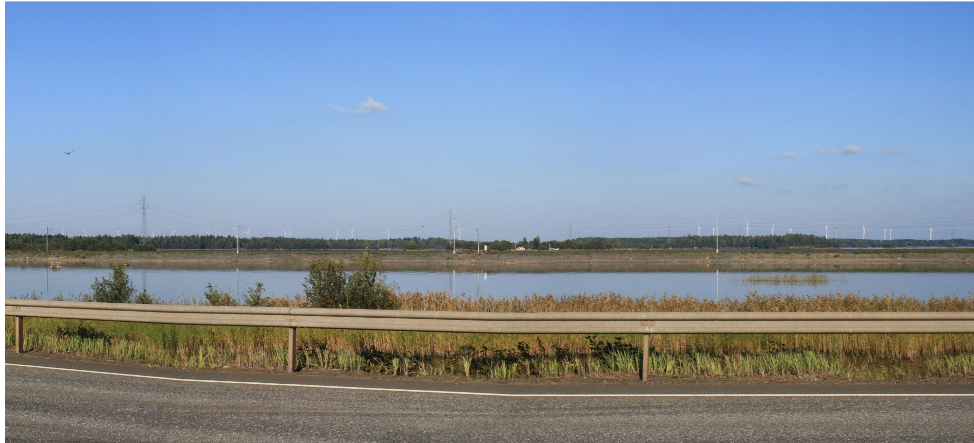
Kuvauspiste J. Kuvasovite yhteisvaikutuksista olemassaolevan Peittoon tuulivoimapaiston kanssa Reposaaren sillalta. Koostettu panorama, kuvattu 53 mm polttovälillä. Etäisyys lähimpään Peittoon tuulivoimalaan 7,6 km ja 13,1 km lähimpään Lammin tuulivoimalaan . Voimaloiden kokonaiskorkeus Peittoon 200 m ja Lammi 250 m.