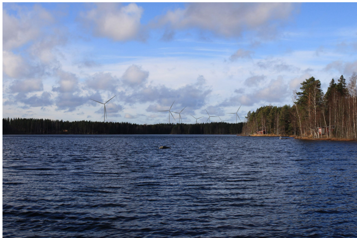
Kuvauspiste B. Kuvasovite Lampinjärveltä. Kuvattu 51 mm polttovälillä. Etäisyys lähimpään tuulivoimalaan 2,9 km. 14 tuulivoimalaa, kokonaiskorkeus 250 m.