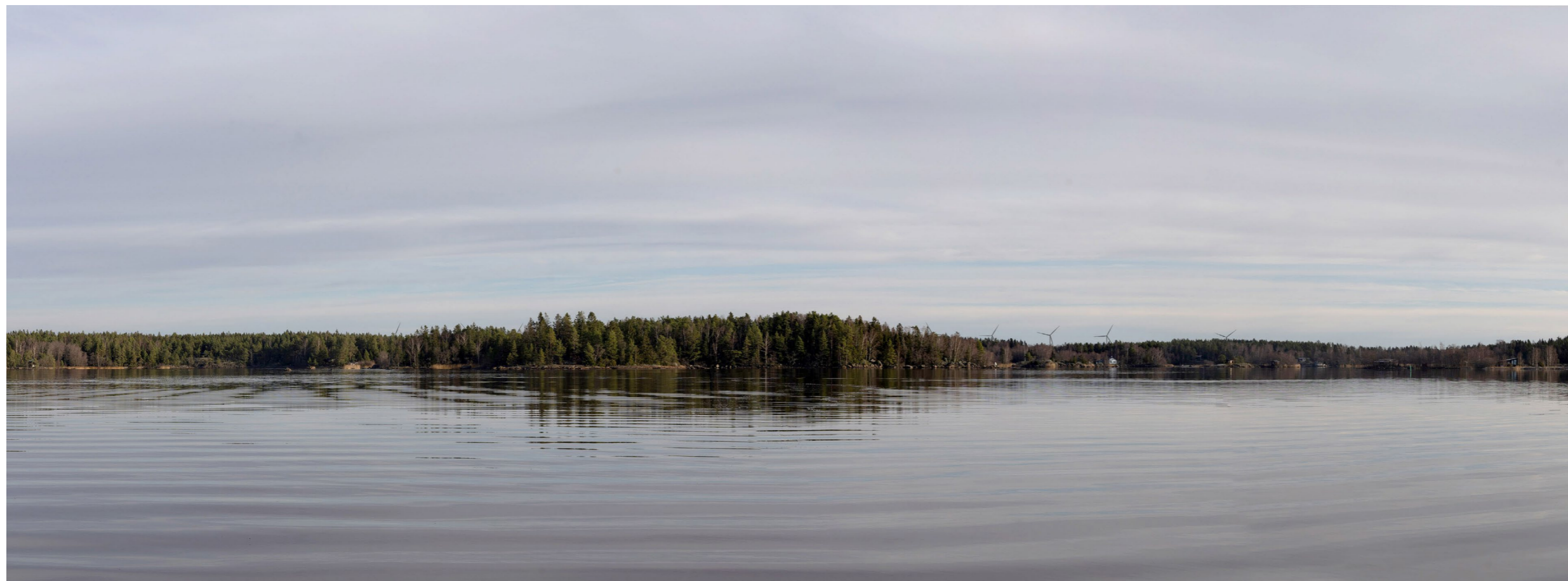
Kuvauspiste L. Kuvasovite mereltä Haukiluodon kohdalta hankealueelle päin. Koostettu panorama, kuvattu 50 mm polttovälillä. Etäisyys lähimpään tuulivoimalaan 8 km. Voimaloiden kokonaiskorkeus 250 m.