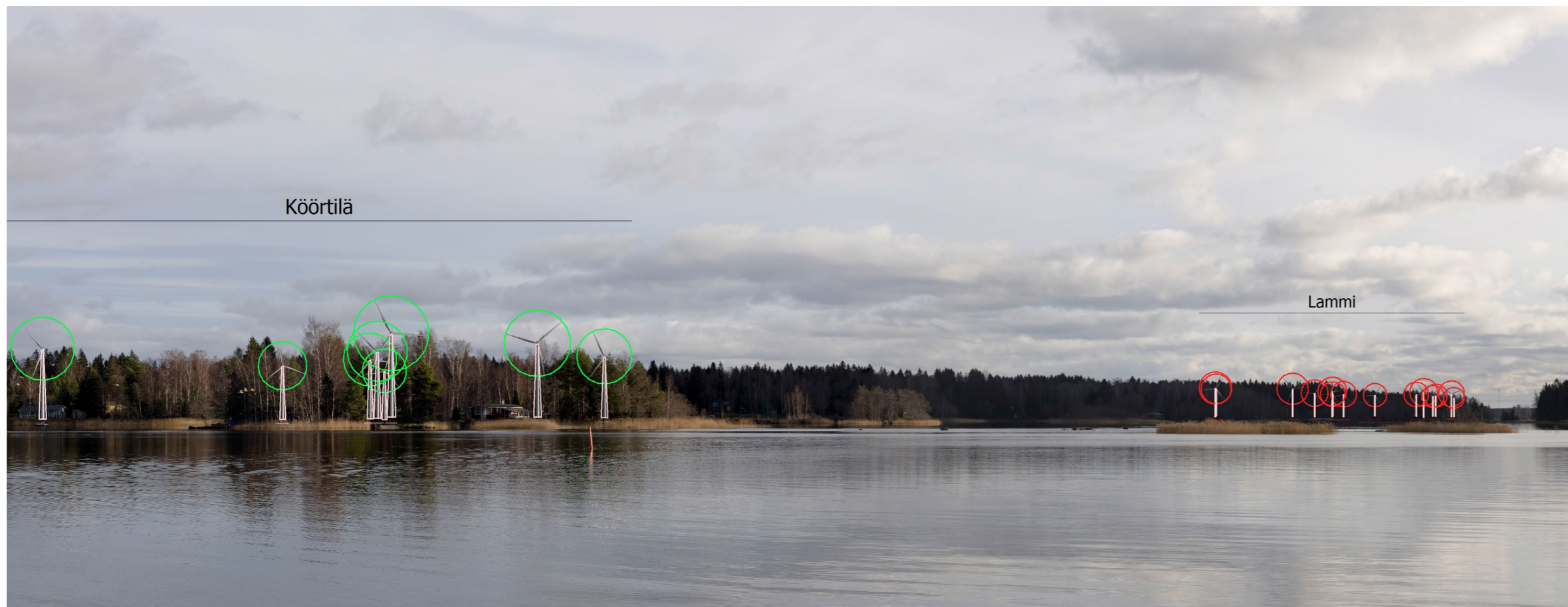
Köörtilän ja Lammin tuulivoimalat merkittyinä.