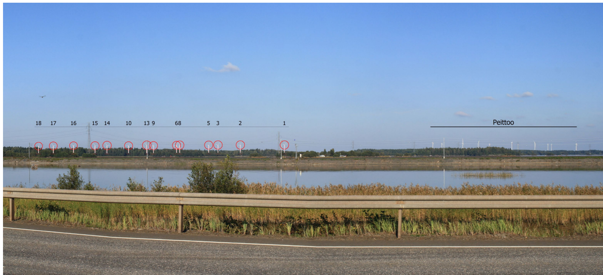
Lammin ja Peittoon tuulivoimalat merkittynä.