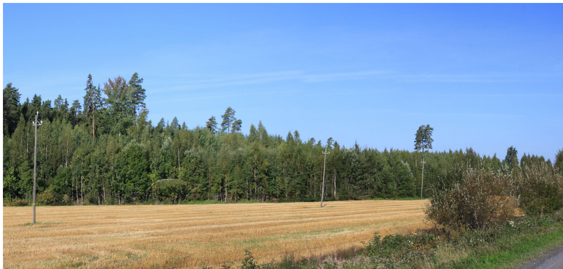
Kuvauspiste H. Kuvasovite Hallakorventieltä. Koostettu panorama, kuvattu 53 mm polttovälillä. Etäisyys lähimpään tuulivoimalaan 2 km. Voimaloiden kokonaiskorkeus 250 m.