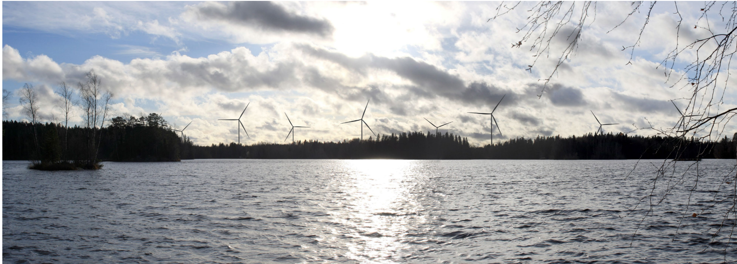
Kuvauspiste A. Kuvasovite Uksjärveltä. Koostettu panorama, kuvattu 51 mm polttovälillä. Etäisyys lähimpään tuulivoimalaan 2,2 km. 14 tuulivoimalaa, kokonaiskorkeus 250 m.