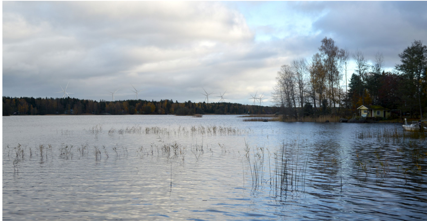
Kuvauspiste D. Vertailukuva, jossa päällekkäin 250 m ja 220 m voimalat. Kuvasovite Keikveden rannalta. Valokuvat otettu 57 mm polttovälillä. Etäisyys lähimpään tuulivoimalaan 4,2 km.