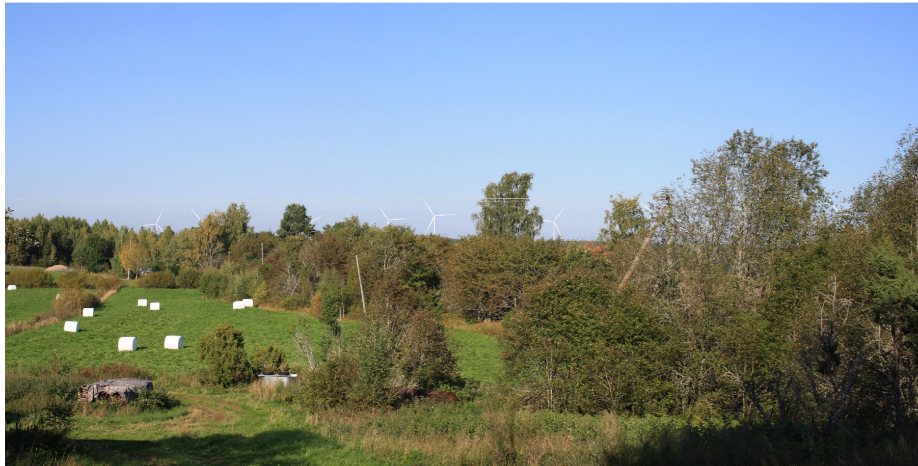
Kuvauspiste G. Kuvasovite Ahlaisten kirkolta. Koostettu panorama, kuvattu 53 mm polttovälillä. Etäisyys lähimpään tuulivoimalaan 3,9km. Voimaloiden kokonaiskorkeus 250 m.