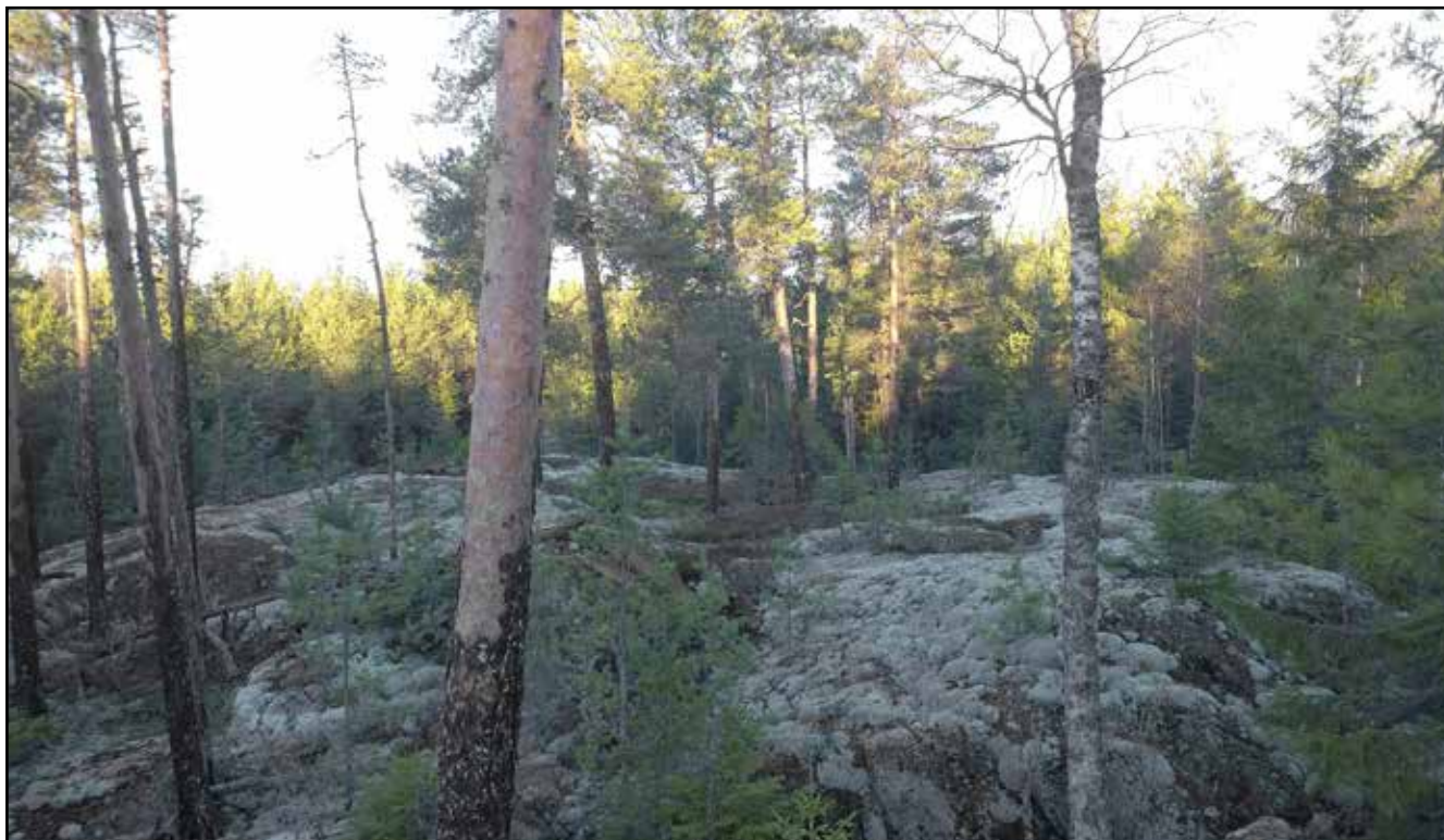
Turbiinipaikka 5. Kalliomännikkö ja kanervatyypin (CT) kuiva kangas