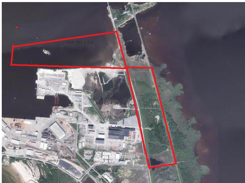
Kuva 3. Suunnittelualueen nykyinen maankäyttö.

Kohteessa ei ole tehty tutkimuksia, sillä Mäntyluodon alueella sijaitsee meri ja Kirrisannan alue sijaitsee rantavyöhykkeellä, jossa pohjaveden pinta on lähellä merenpinnan tasoa.