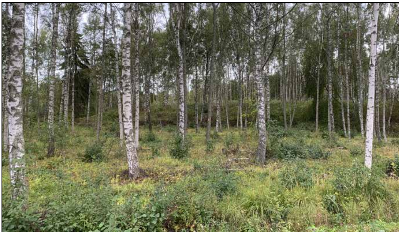
Valtaosa alueesta on harvennushakattua koivikkoa.