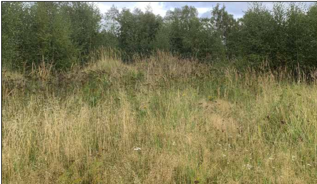
Vanhan kaatopaikan kasvillisuutta.