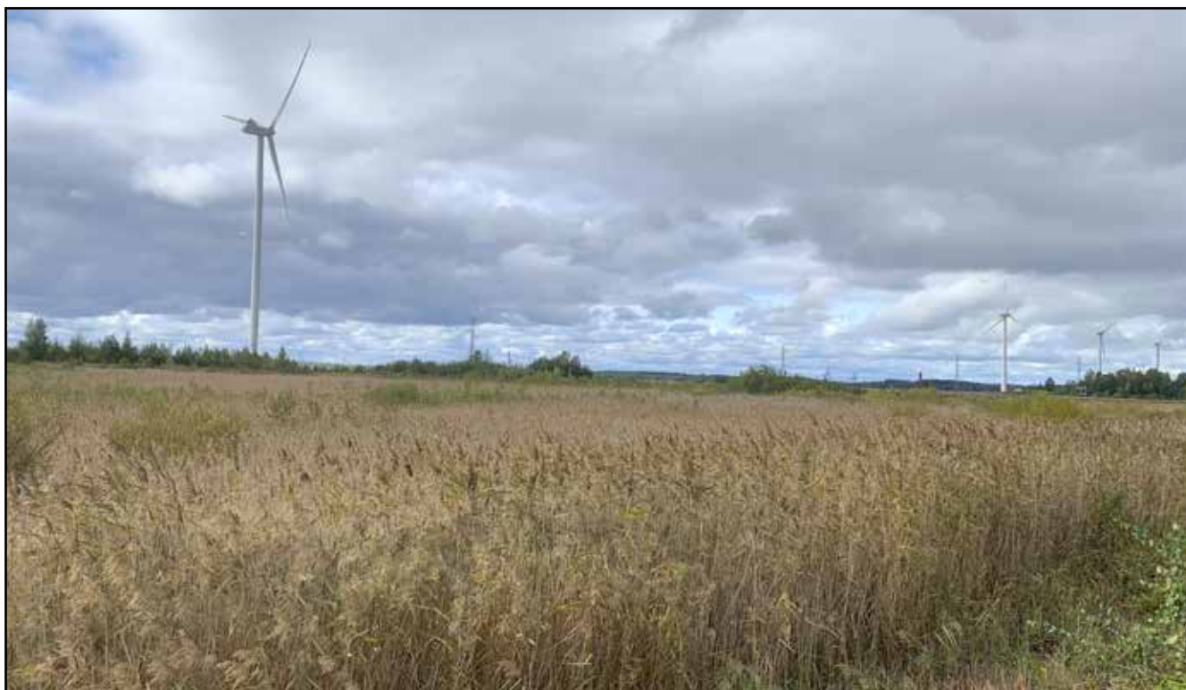
Tutkimusalueen pohjoisosan järviruokoyhdyskuntaa.