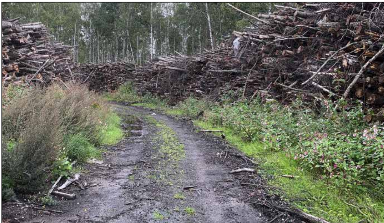
Kaatopaikalle johtavan tien varrella säilytetään puupinoja.