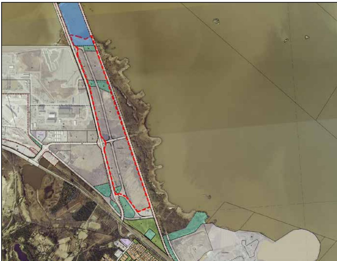
Kuva 1. Kirrisannan tutkimusalue (punainen katkoviiva).