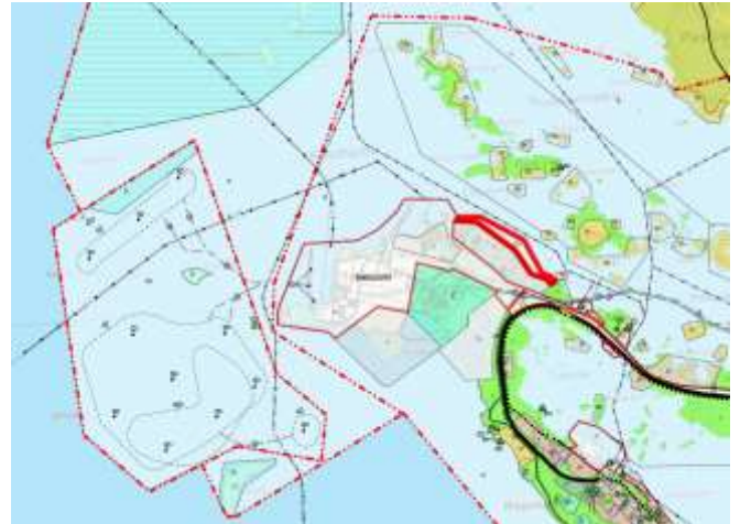
Kuva 4. Ote yleiskaavayhdistelmästä.

merituulipuiston osayleiskaavaan. Sen perusteella on rakennettu 11 tuulivoimalaa Tahkoluodon lounaisen puolisolle merialueelle.