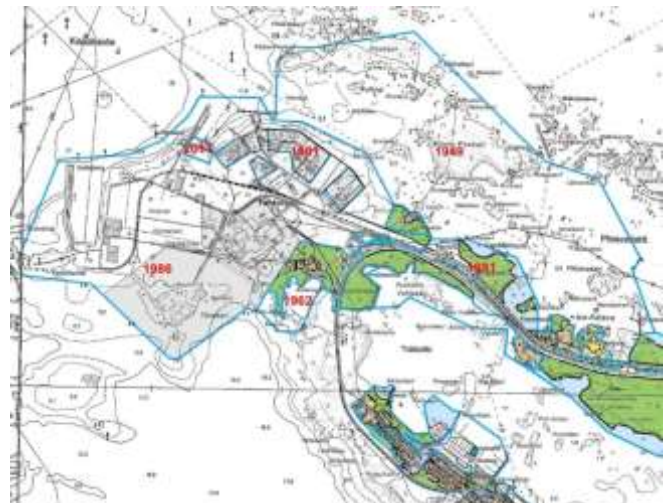
Kuva 5. Ote saaristoasemakaavalla täydennetyistä asemakaavayhdistelmästä.

Tahkoluodon asuntoalueella ja sitä ympäröivällä metsätalousalueella on 25.7.1962 vahvistettu asemakaava. Öljysäiliöiden kortteleita ja puistoalueita koskeva asemakaava on vahvistettu 23.4.1981. Satama-, teollisuus-, voimalaitos- ja rautatiealueiden asemakaava on vahvistettu 13.8.1986. Nesteytetyn maakaasun (LNG) tuontija varastointiterminaalin asemakaava on hyväksytty 9.12.2013.