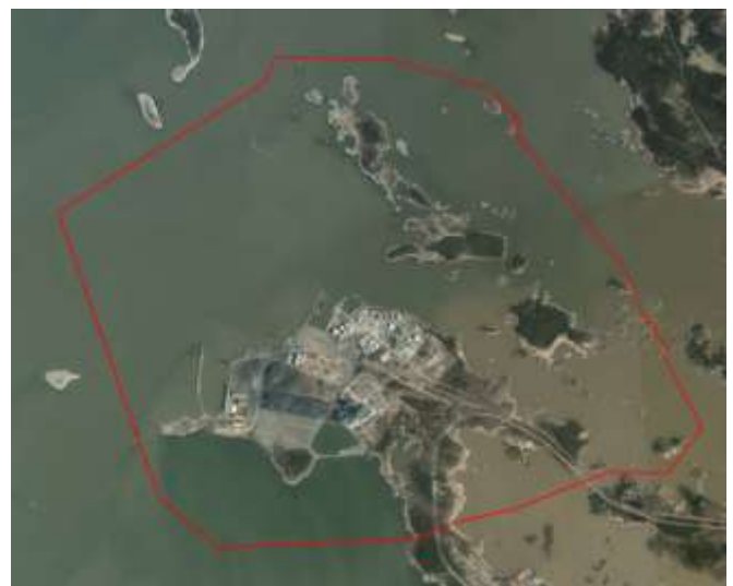
Kuva 2. Suunnittelualue ilmakuvasa.