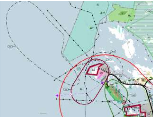
Kuva 3. Ote maakuntakaavayhdistelmästä.

Tahkoluotoon on osoitettu maakuntakaavassa satama-aluetta LS, energiantuotantoa EN, teollisuutta ja varastointia T ja T1 (jälkimmäinen sallii vaarallisten kemikaalien käsittelyn ja varastoinnin) sekä näiden laajentumissuuntia, maantie, rautatie, laiva- ja veneväylät, voimajohto ja varaus uudelle sekä kaasuverkon yhteystarve. Tahkoluotoa ympäröivät satamatoimintojen kehittämisen kohdealue ls ja vaarallisten kemikaalien suojavyöhyke (konsultointivyöhyke) sv1. Alueelle yltää Kokemäenjokilaakson nauhamainen kaupunkikehittämisen kohdealue. Alueen luoteispuolelle merelle on osoitettu Selkämeren kansallispuistoon kuuluvia suojelualueita ja länsipuolelle laaja merituulipuiston alue tv.